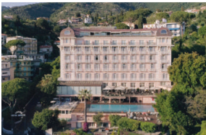
Grand Hotel Bristol Resort&Spa, Rapallo

Per chi ama sognare e vivere un'esperienza assolutamente unica, il nuovo lusso nell'ospitalità ha un nome: R Collection Hotels. Un concetto di accoglienza made in Italy. In questo numero l'acqua è l'elemento predominante. Dal Grand Hotel Bristol Resort&Spa di Rapallo all'Hotel Royal Victoria di Varenna. Dimore storiche e luoghi di fascino, dal mare al lago