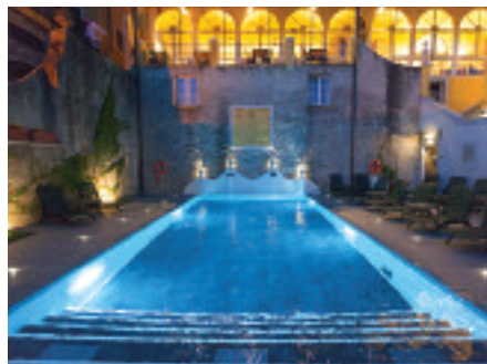
Hotel Royal Victoria, Varenna

In nessun altro luogo come qui a Varenna, dove l'acqua è dolce, il corpo e la mente ritrovano i propri ritmi, si può immaginare un copione differente. La struttura oggi si caratterizza come un esclusivo small luxury hotel, arredato con mobili di pregio che sanno far vivere ai propri ospiti esperienze uniche. Vero protagonista di una vacanza all'hotel Royal Victoria è sicuramente il Lago di Como, dove trascorrere soggiorni unici tra itinerari in quota e gite in battello tra le varie località lacustri, che nella bella stagione riservano moltissime novità glam. L'ospite è al centro del soggiorno e tra mille coccole in stile beauty e con una proposta food inequivocabilmente al top, può rigenerarsi nella modernissima Suite Spa dell'Hotel o tuffarsi nella splendida piscina affacciata sulle acque del lago. Sul fronte gastronomico, uno dei plus della struttura, vengono proposte due location particolari: ai piedi della Chiesa di San Giorgio nella piazza centrale di Varenna, il ristorante pizzeria Victoria Grill, oppure la terrazza panoramica del raffinato ristorante Gourmet. Alla guida lo chef Maurizio Lazzarin. L'hotel offre, inoltre, un nuovo spazio giardino con bar, dove rilassarsi con un cocktail o gustare un light lunch nello spettacolare scenario del lago. S.F.