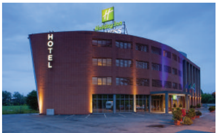
A sin. (left) Hotel San Marco Sotto (below), Holiday Inn Express