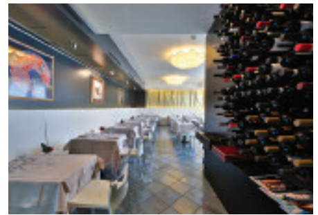
Best Western Hotel Farnese

Elegant and flooded with light, the grand lobby of the Best Western Hotel Farnese, whose name is inspired by the family that more than any other shaped the history of the city, welcomes guests to a facility with a strong business vocation. In addition to offering the only outdoor swimming pool with Jacuzzi in the town centre, it proposes a congress centre with three rooms and a maximum capacity of 60 seats. In the hotel there are also four other options, the only day offices in Parma, fully equipped offices during the daytime, while at night they become comfortable bedrooms. Aside from the pool during the warm months, the hotel's core is the Ristorante 51/A . It is going to be totally renovated by the end of March 2018 and it is specialised in traditional Parmesan dishes and typical local products tastings, with a particular attention to international cuisine and new food trends.