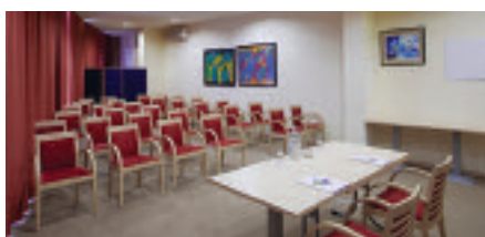
Holiday Inn Express

Dynamic, young and essential, but with all the amenities required by a leisure trip or a business appointment, the Holiday Inn Express Parma is the group's three-star hotel. Less centrally located, yet easily accessible from the major roads and convenient for visiting the main city attractions, the hotel offers 70 guest rooms, a restaurant with traditional Parmesan cuisine and a 50-seat meeting room. Here, the events follow the "Meet Smart at Holiday Inn Express" formula; a simplified version that allows to quickly organize gatherings, meetings and training courses in a fully functional space for small groups. G.G.