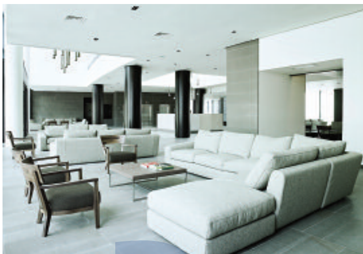
Quattro ambienti del DoubleTree by Hilton Venice North.

Da un'intuizione a una strategia. Sette anni fa l'intuizione, ben presto confermata, che non ci si dovesse limitare alla gestione di un hotel avveniristico. Dopo lo start up si passò all'acquisto e al rilancio dell'Hotel, in collaborazione con un brand prestigioso, da cui nacque il DoubleTree by Hilton Venice North di Mogliano, nell'area metropolitana di Venezia. L'intuizione è diventata strategia vincente, tanto che nel luglio 2017, un nuovo acquisto immobiliare, sempre nella zona di Venezia Mestre, ha visto nascere una nuova realtà; il Four Points by Sheraton Venice Mestre .