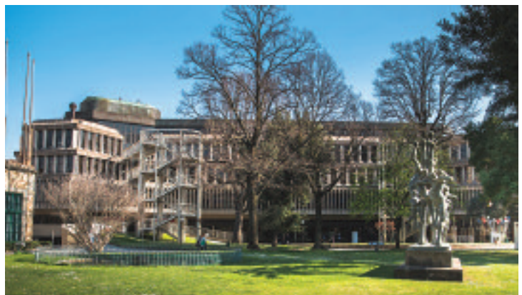
Palazzo degli Affari