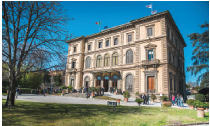
Palazzo dei Congressi (già Villa Vittoria)

programma dal 29 maggio al 1° giugno 2019, che torna nuovamente nel nostro quartiere dopo solo sei anni dall'ultima edizione fiorentina.