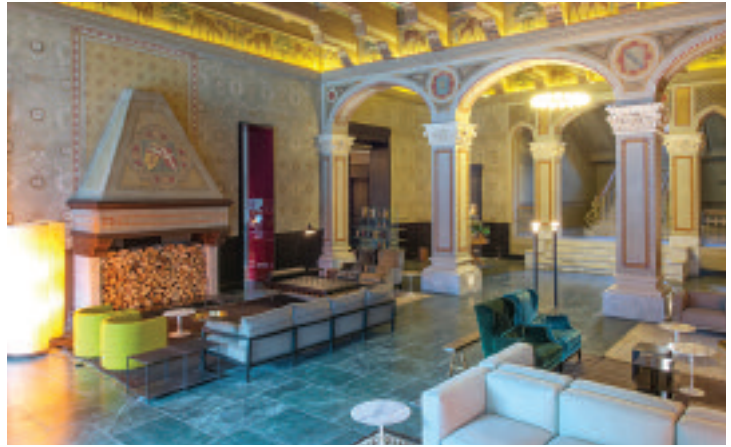
Hall Grand Hotel Billia

per il relax e la "remise en forme", con formule specifiche e personalizzate. La SPA offre 5 beauty room, un percorso Kneipp, una piscina che prosegue all'esterno, con vista sulla montagna, una vasca idromassaggio con cascata cervicale (alta 1,20 metri, acqua a 33 gradi), bagno turco di marmo con cromoterapia, sleeping room con cromoterapia, biosauna in legno, sauna finlandese, cascata di ghiaccio per effetto scrub, docce benessere per tonificare ed energizzare, una zona relax con tisaneria e una palestra con macchinari di ultima generazione, sempre con collegamento free wi-fi. Il tutto completato da trattamenti che, grazie al contributo di un team internazionale di esperti in discipline mediche e umanistiche, che lavora con passione e competenza per conferire un significato nuovo al termine "olistico" e far sì che la pelle sia espressione di salute e gioia. Nella bella stagione, si apre la piscina esterna con ampia terrazza, per rilassarsi in armonia con gli alberi secolari del parco.