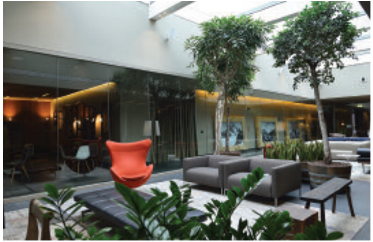
Hall Parc Hotel Billia

Another strong point of the Resort is L'EVE (The Water), a 1,700-square-meter Wellness Centre, with water programs and swimming pools to enjoy the healthiest properties of the purest mountain water and to benefit from the rituals specially studied for relaxation and the 'remise en form', with specific and personalized formulas. The spa offers 5 beauty rooms, a Kneipp program, a swimming pool that continues outside with mountain view, a cervical waterfall (1.20-metre high, 33°C water), a marble Turkish bath with chromotherapy, sleeping room with chromo-