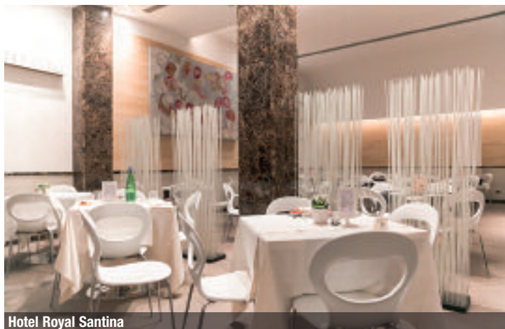
Hotel Royal Santina

Modern and elegant, the Best Western Plus Hotel Universo is located at just 200 meters from the train station Roma Termini, main crossroads of the public transportation of the Capital. It has the biggest Congress Centre of the Gruppo Roscioli: 10 meeting rooms and a total capacity of almost 760 people. Among the novelties, the new sala Anna Maria able to host up to 300 participants and divisible in two