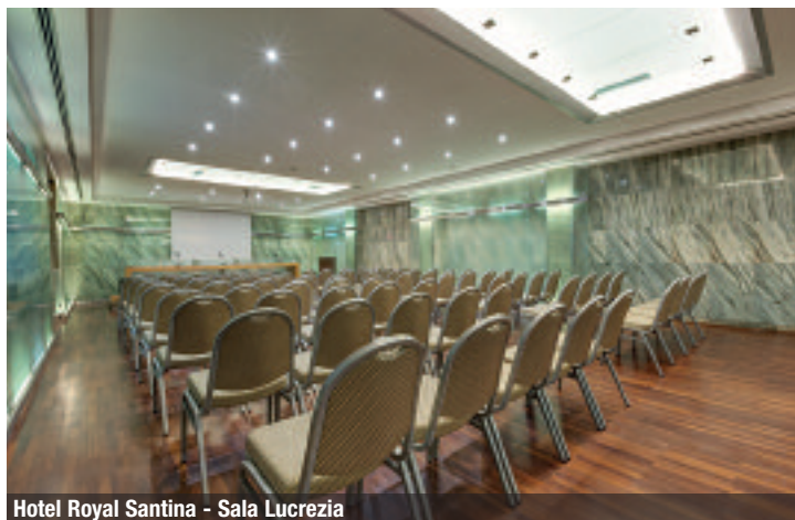
Hotel Royal Santina - Sala Lucrezia

different rooms, the sala Anna and the sala Maria. All the rooms of the Hotel Universo are equipped with high speed Wi-Fi, available free also in 198 bedrooms, whose 13 junior suites, and in the common areas. The restaurant of the hotel proposes different menus: international dishes and local specialities, with an extreme care for the customer's needs. This elegant and trendy area is completed by the Lounge Bar, ideal for a quick aperitif or for a relaxing break after a long day at work.