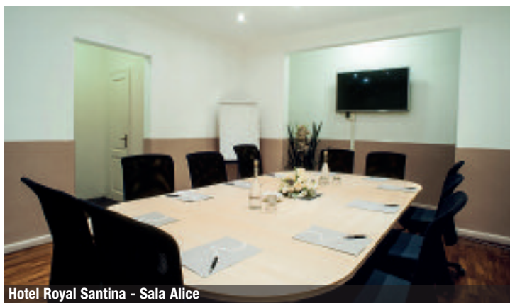
Hotel Royal Santina - Sala Alice

meetings with its meeting room for 30 people. Very comfortable its 192 bedrooms furnished with warm tones and recently renovated. Lastly, surrounded by greenery and comfortably located near the International Airport Leonardo da Vinci, there is the Hotel Aris Garden , equipped with a garden with outdoor pool and a Sport Centre. The Congress Centre has 4 functional meeting rooms for a total capacity of 220 people, perfect for work meetings, conventions, dinner galas and work lunches.