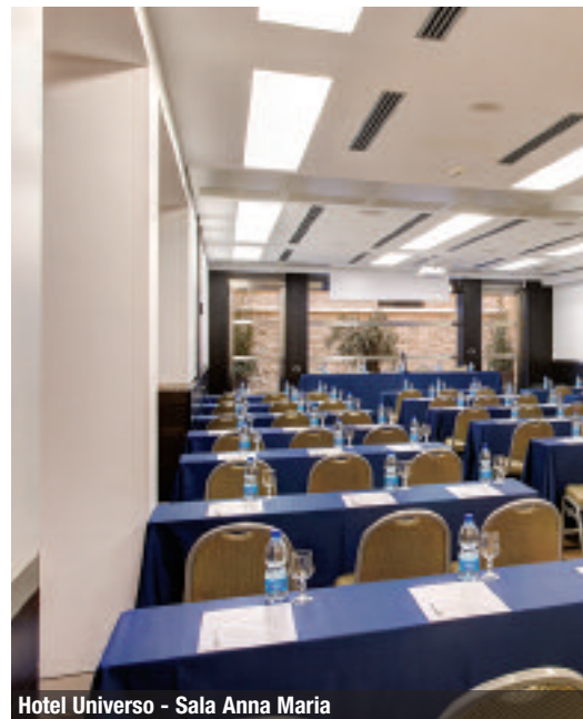
Hotel Universo - Sala Anna Maria