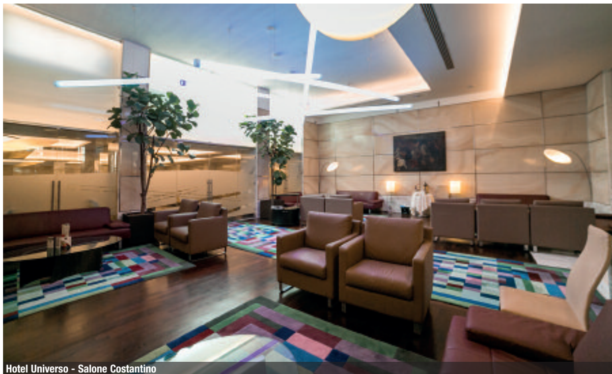
Hotel Universo - Salone Costantino

Successful meetings in the heart of Rome. Elegant four stars hotels that bright among the prestigious chains Best Western and Hilton