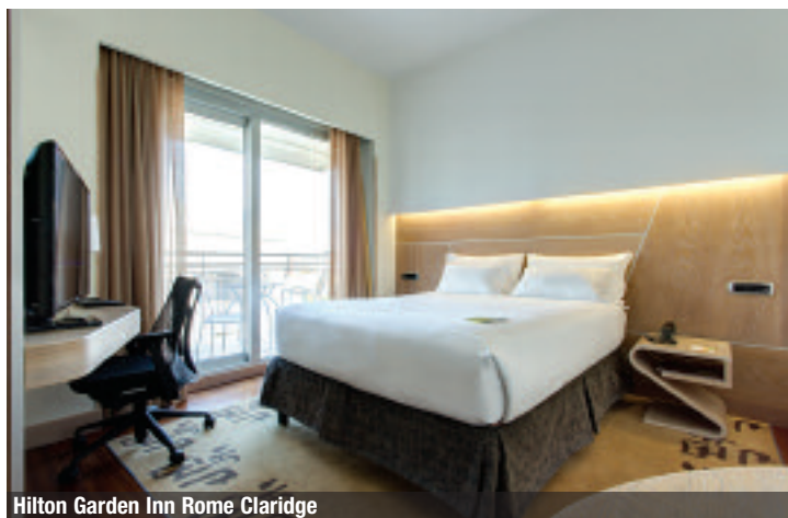
Hilton Garden Inn Rome Claridge

Situato nel cuore dei Parioli, esclusivo ed