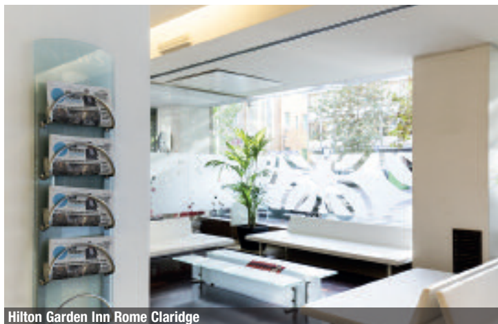
Hilton Garden Inn Rome Claridge

Moderno ed elegante, il Best Western Plus Hotel Universo è situato a soli 200 metri dalla stazione ferroviaria Roma Termini, principale punto di snodo del trasporto pubblico della Capitale. È dotato del Centro Congressi più grande del Gruppo Roscioli: 10 sale meeting e capienza totale di circa 760 persone. Tra le novità, la nuova sala Anna Maria in grado di ospitare fino a 300 partecipanti e divisibile in due sale distinte, la sala Anna e la sala Maria. Tutte le sale dell'Hotel Universo sono provviste di connessione Wi-Fi ad alta velocità, disponibile gratuitamente anche nelle 198 camere, di cui 13 junior suite, e negli ambienti comuni. Il Ristorante dell'Hotel propone diversi menù: piatti internazionali e specialità regionali,