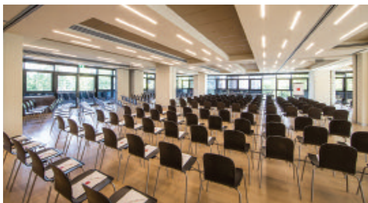
Hotel Bologna Fiera

B ologna, con il centro storico, famoso per i suoi 38 chilometri di portici e per i monumenti di grande valore storico-artistico, con la sua prestigiosa Università, tra le più antiche in Europa e, ancora oggi, tra le più frequentate – nell'ultimo anno ha ospitato oltre 79mila studenti – il suo Aeroporto Guglielmo Marconi, hub internazionale, la sua tradizione enogastronomica e la sua facile raggiungibilità, sia da Nord che da Sud, in treno, con l'alta velocità, e in auto (autostrada A1), è una vivace destinazione bleisure e Mice, capace di stupire e innovarsi di continuo. Fiere, mostre, percorsi museali, eventi d'arte, di teatro e di musica ne fanno una capitale culturale cosmopolita vivacissima e di grande appeal, dove la vocazione internazionale va di pari passo con la memoria. Tutti atout particolarmente graditi alle aziende che, nel capoluogo emiliano trovano un mix di nuovo e di tradizione davvero unico, oltre a un'offerta ricettiva