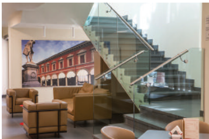
Hotel Bologna Fiera

A varied and high-level MICE & Bleisure offer. For all needs