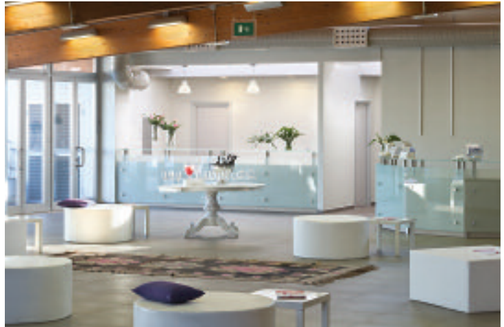
UNAWAY Hotel Bologna San Lazzaro

bright rooms you notice the attention to details. The hotel offers a modern Conference Centre consisting of modular meeting rooms with natural light which host a maximum of 270 persons. You can choose between the Ascari room which counts 130 seats, it can be divided in 3 spaces that host 35 guests, or the Nuvolari and Fangio rooms which can host up to 70 guests and can be divided in two 35 seats business rooms. Each area of the Business Center is named after a famous pilot, symbolizing the modern and dynamic connection of the Hotel which pay homage to the region of Emilia Romagna, home of motors in Italy. Atahotel Bologna express its soul in the culinary heart. You can enjoy fine cuisine and attention to every single detail, from presentation to the quality of ingredients.