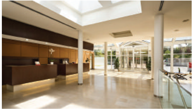
UNAWAY Hotel Bologna San Lazzaro

L'Atahotel Bologna si trova in Via Larga, inserito all'interno del più ampio progetto costituito dalla torre Unipol e da un edificio di collegamento in cui si sviluppano diversi ristoranti e un centro fitness. Realizzato secondo un progetto architettonico di design, sviluppato su ben sette piani, ospita al piano terra la prestigiosa hall d'ingresso, il ristorante, la sala colazioni e il lounge bar. Pernottando in una nelle