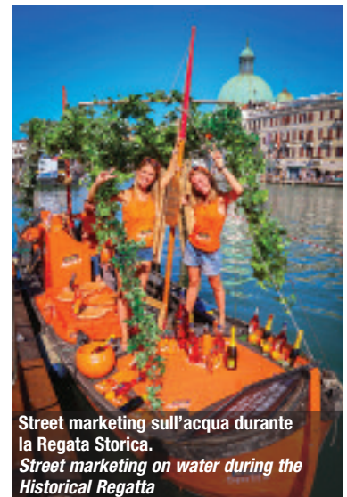
Street marketing sull’acqua durante la Regata Storica. Street marketing on water during the Historical Regatta