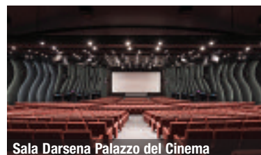
Sala Darsena Palazzo del Cinema

Già l'organizzare un evento a Venezia dà a un pco, a un event manager, un blasone in più, qualunque brand infatti gode del valore aggiunto dell'effetto "WOW Venezia". Naturalmente, a meno che non si conosca perfettamente la città, è bene collaborare con chi semplifica la vita, per l'utilizzo degli spazi pubblici, anche acquei della città, con possibilità di far arrivare comunicazione commerciale a milioni di turisti. Per esempio un vaporetto brandizzato con immagini e loghi, uno stando posizionato sulla balaustra di un ponte, dei totem agli imbarcaderi, fanno la differenza.