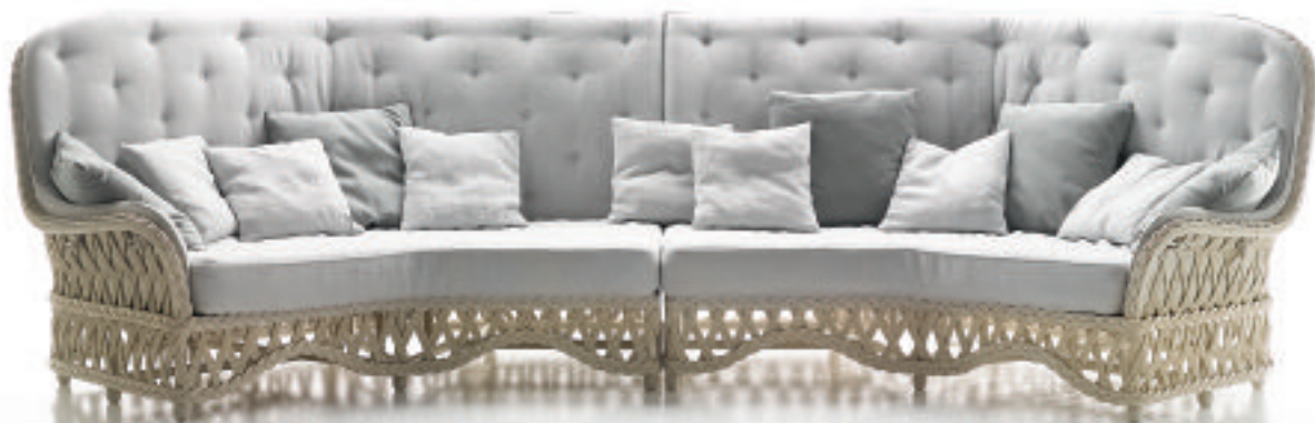
Divano (sofa) Embassy®, designer Piero Pinto

ricevette l'incarico di disegnare due poltrone, l'architetto si rivolse senza esitazione a Vittorio Bonacina, che aveva acquisito una grande esperienza accanto al padre. La presentazione della rivoluzionaria "Margherita" alla IX Triennale – premiata con la medaglia d'oro – fu un momento storico per il mondo del design e l'inizio di una nuova vita per l'azienda, il primo passo per una proficua amicizia con grandi progettisti. Un ricco archivio di disegni e prototipi custodisce con cura e passione la collaborazione fra maestri artigiani e nomi che hanno fatto la storia del design in Italia e nel mondo: Albini, Aulenti, Forges Davanzati, Gregotti, Mongiardino, Ponti, Sambonet, Travasa... una strada difficile ma coraggiosa e stimolante. Intuito e qualità straordinaria sempre riconosciuti alle Triennali, ai Compassi d'Oro dagli anni '50 in poi, fino alle più importanti manifestazioni di design degli anni '90 e del nostro secolo in giro per il mondo Un posto speciale è ri-