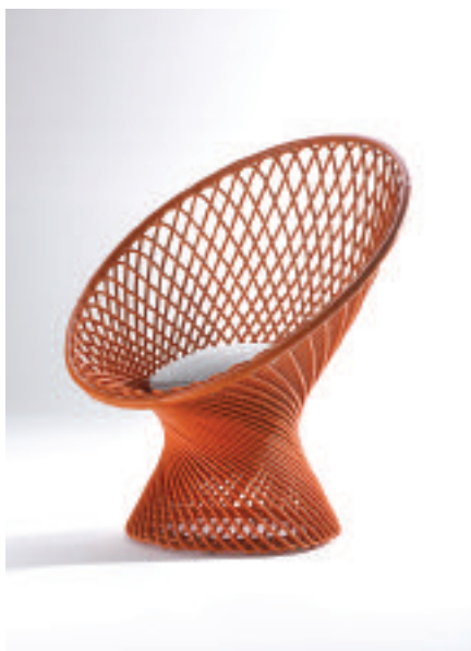
Poltrona (armchair) Primavera®, designer Franca Helg

La quarta generazione, forte delle sue radici, si proietta verso il futuro rinnovandosi ed evolvendosi continuamente con spirito dinamico ed appassionato. Ci sono gesti e profumi che accompagnano ogni lavoro e quello dei Bonacina, in particolare: è la loro maestria nel bagnare, piegare, asciugare e quell'aroma di paesi lontani che sprigionano le canne d'India, di Manau e di Manila. Movimenti immutati nel tempo al servizio di un design che sgorga dalla materia stessa: nulla come il giunco impone scelte precise, studiate e per questo antiche e moderne insieme. Il saper fare e il guardare avanti che sono da sempre nel DNA della famiglia Bonacina. A Lurago d'Erba, Giovanni fece tesoro dell'arte dell'antico mestiere di canestraio e, più di un secolo fa, fondò la sua azienda, ampliando ben presto la sua produzione con poltrone, salotti ed elementi d'arredo. Il successo non tardò ad arrivare, con i riconoscimenti internazionali del 1909 a Londra e a Parigi e del 1910 a Roma e commesse importanti, come la fornitura per il Grand Hotel Villa d'Este a Cernobbio (Como). La attività di arredare ville patrizie proseguì per tutti gli anni '40 e fece della Bonacina la migliore azienda italiana che produceva arredi in giunco e midollino in quel momento. Quando, nel 1951, Franco Albini