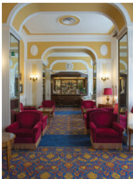
Massimo D’Azeglio. In basso, Sala Cavour Hotel Atlantico

comes a new starting point, where the location, usability and flexibility of the offer become the new values of an all-Italian history. c.c.