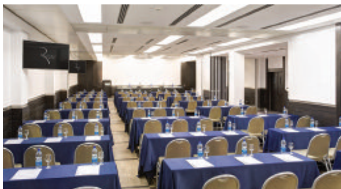
Sopra (above) Annamaria meeting room Hotel Universo. Sotto (below) smartphone Manet. A destra (on the right) comfort room Hotel Universo

Successful meeting in the heart of Rome for one of the most important Roman conference companies, thanks to increasingly advanced business services