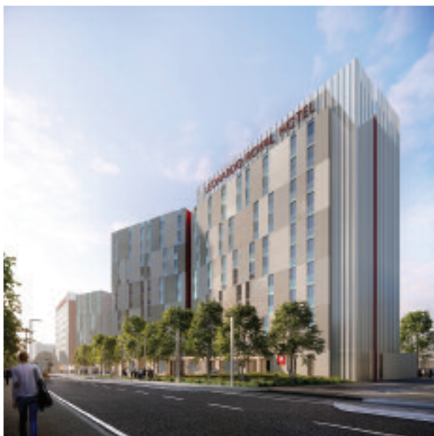
Leonardo Royal Hotel Venice Mestre

Nell'estate 2019 sarà inaugurata la terza struttura italiana il Leonardo Royal Hotel Venice Mestre . Un Hotel 4 stelle superior altamente curato nell'architettura, nelle scelte cromatiche e nel design funzionale e ideato per ospitare il segmento MICE al quale si rivolge con 3 sale meeting, 2 boardroom e una sala "Royal Ballroom" capace di accogliere 165 posti. Le 243 camere a disposizione riservano un'area "women friendly", studiata appositamente per il target femminile, spaziando dal cibo ai numerosi servizi specifici. L'hotel celebra 'il gusto' del buon vivere all'italiana con il ristorante "Vitruv" (con 185 coperti), il lounge bar "Leo" ed una fitness room. La vicinanza geografica alla città lagunare offre agli ospiti l'occasione imperdibile di visitare Venezia. L'opening ormai