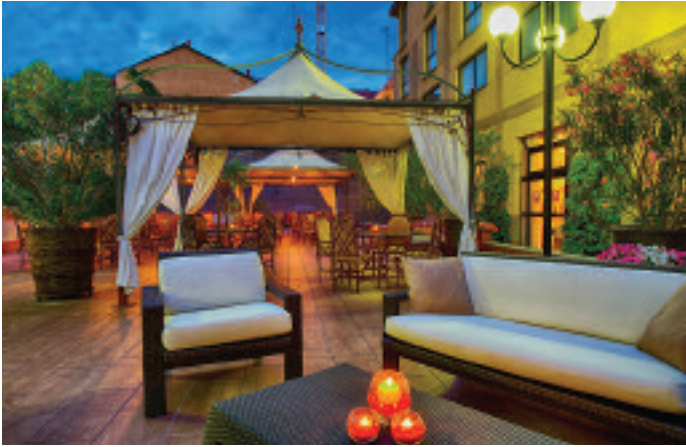
Leonardo Hotel Milan City Center

Leonardo's excellence, between business mind and bleisure soul. History of a growing group that loves Italy