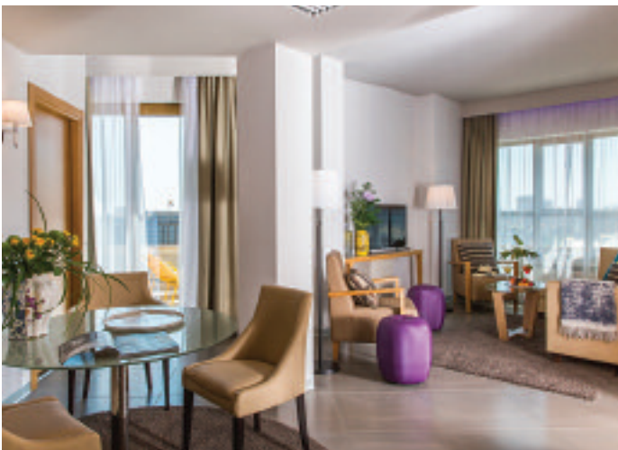
NYX Hotel Milan

The hotels are located in Austria, Belgium, Germany, Hungary, Switzerland,