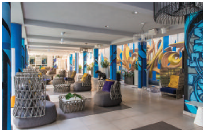
NYX Hotel Milan

ting e congressi, senza tralasciare il segmento leisure e i gruppi. Con oltre 28mila camere e più di 800 conference room il gruppo si afferma rapidamente come importante player nel settore alberghiero attraverso una politica di acquisizioni e fusioni, guidate dalla perspicacia del fondatore israeliano David Fattal.