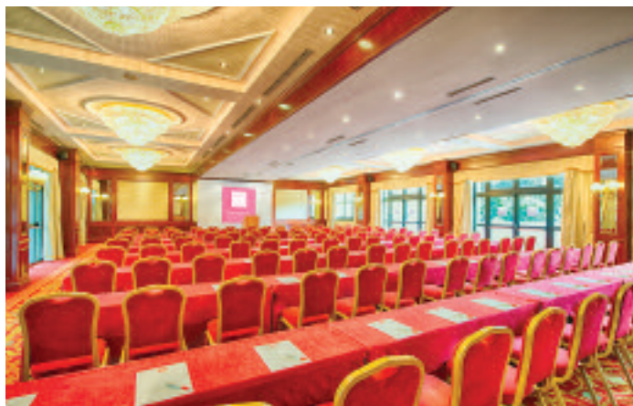
Leonardo Hotel Milan City Center

L'eccellenza di Leonardo, tra mente business e anima bleisure. Storia di un gruppo in crescita che ama il bel paese