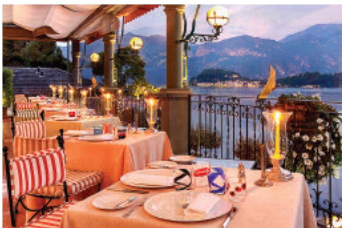
Terrazza Gualtiero Marchesi

La nuova stagione, che per il Grand Hotel Tremezzo inizierà ad aprile, si apre con un'altra grande novità, questa volta relativa all'offerta enogastronomica. Cambia infatti il concept di entrambe le proposte food&beverage: il ristorante gourmet La Terrazza, già sotto la guida del grande maestro Gualtiero Marchesi, diventerà l'unico ristorante nel mondo legato al