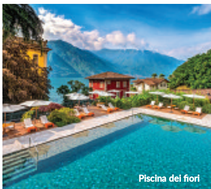
Piscina dei fiori