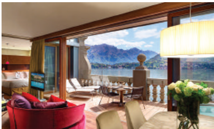
Roof Top Front Suite