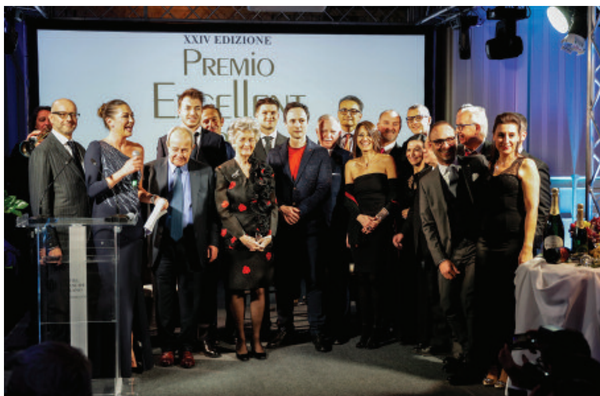
Sul palco tutti gli sponsor della XXIV edizione del Premio Excellent

Dal 1982 Trademark Italia è la società italiana leader nella consulenza di marketing per l'industria dell'ospitalità. Con le sue consulenze specialistiche, gli osservatori turistici, i progetti alberghieri, gli studi d'area, i piani di sviluppo e i business plan, è in grado di assistere, con la stessa efficacia e competenza, enti pubblici e operatori privati. Trademark Italia si distingue da tutte le società di consulenza per l'esperienza internazionale, per l'abilità di decifrare il mercato, per la sua cultura di management turistico, per le sue pubblicazioni e per i suoi manuali utilizzati da Università e aziende del settore. Dal 2002 è partner del network mondiale di Cayuga Hospitality Consulting Professionals. www.trademarkitalia.com