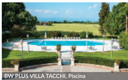
BW PLUS VILLA TACCHI, Piscina

rappresenta l'essenza dello charme e della tradizione che caratterizzano lo stile delle dimore storiche venete. Grande impatto emozionale per una location, in provincia di Padova, capace di offrire alta professionalità applicata ai trend del "gusto" del turismo Bleisure. Le 49 camere, unite al centro congressi composto da 7 sale con capienza massima pari a 300 posti e al meraviglioso parco, costituiscono un gioiello dell'offerta Best Western, capace di rispondere in maniera straordinaria e puntuale alle richieste più innovative del turismo business come ad esempio un team building indoor e outdoor ad "alto tasso emozionale" quanto a quelle private di un matrimonio "a regola d'arte".