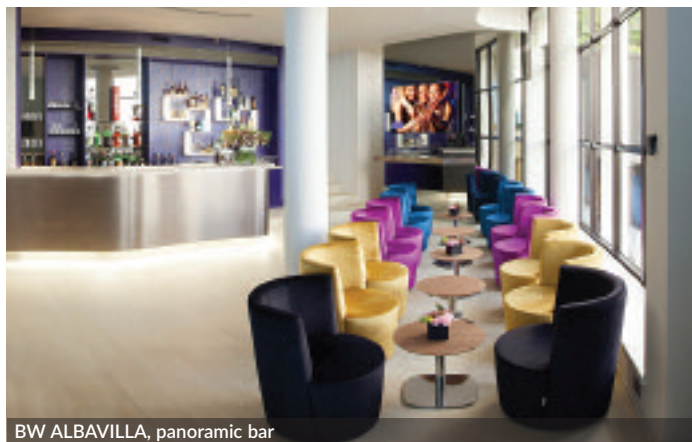
BW ALBAVILLA, panoramic bar