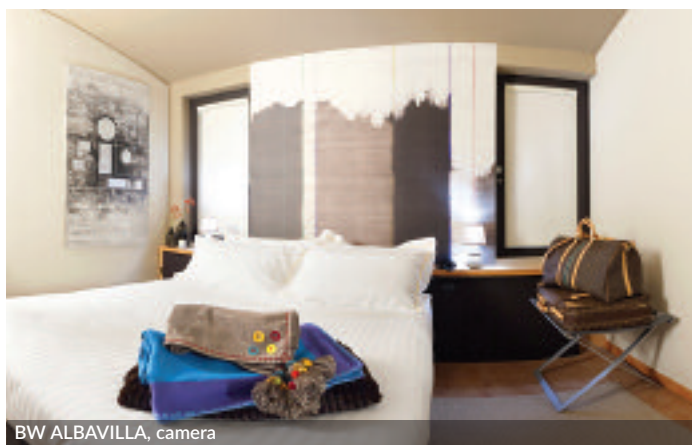
BW ALBAVILLA, camera

Nel 2018 il fatturato complessivo degli hotel Italiani affiliati a Best Western ha raggiunto i 300 milioni di euro, il fatturato transato sui canali Best Western 100 milioni di euro (+7%). Il 2018 soprattutto ha garantito a Best Western un record di nuovi ingressi nel network, con 24 nuovi hotel e oltre 1200 camere in più: un forte segnale dal mercato che sempre più si affida alla forza di un brand e alla sua capacità di offrire supporto personalizzato alle specifiche esigenze di business degli hotel. Sono 38 milioni gli iscritti al loyalty program globale Best Western Rewards® uno dei pochi programmi a raccolta punti che permette ai soci di raccogliere punti che non scadono mai e validi in ogni hotel Best Western del mondo.