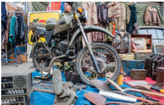
Eventi per tutti i gusti: da sinistra il festival Sonic Park a Stupinigi e lo storico mercato del Gran Balon

musicale pop e rock: quest'anno presenti tra i tanti King Crimson, Francesco De Gregori, Mark Knopfler e Eros Ramazzotti). Sempre grande musica grazie alla tredicesima edizione di MITO Settembre Musica , festival che ospita artisti e orchestre di livello internazionale che proporranno un fitto calendario di musica colta nei teatri e, insieme, concerti nelle biblioteche, nei parchi, nelle librerie e nei musei periferici. Dalle 8 alle 18, la seconda domenica di ogni mese, anche in estate, si svolge il Gran Balon , mercato dell'antiquariato della città di Torino. Si espande tra le vie Lanino , Mameli , Canale Carpanini , Borgo Dora e coinvolge 250 bancarelle, 50 negozi, bar e ristoranti. Infine ecco SVincoli , l'articolata manifestazione che a giugno e luglio occupa l'ex Cimitero di San Pietro in Vincoli . Aperta per tutta la giornata dalle 8.30 include concerti, presentazione di libri, spettacoli teatrali, la quinta edizione di Summer Kids , centro estivo dedicato alle arti, la prima edizione di Jazz Is... , la seconda edizione di Summer Nights , rassegna di spettacoli per bambini e famiglie, aperitivi sonori e Dj set.