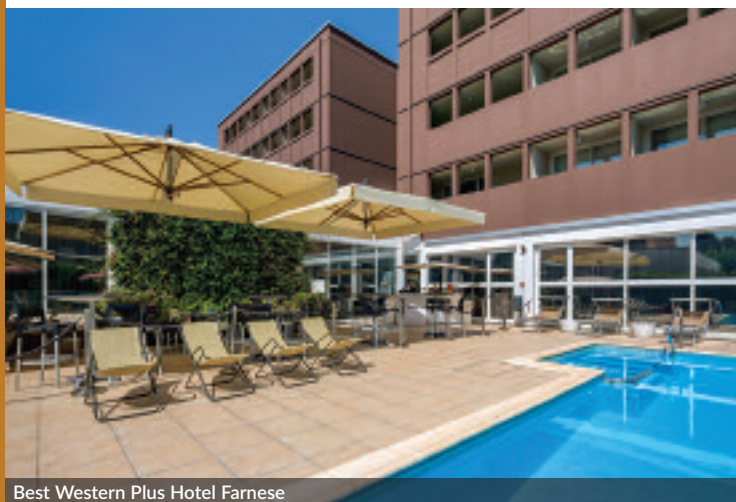
Best Western Plus Hotel Farnese

Connessione e informazioni 24/7, spazi per lavorare e caffè illimitati: questi sono solo alcuni dei servizi pensati per il business traveller nelle strutture INC, come il BW Plus Hotel Farnese che, non solo dispone di tre sale per incontri e riunioni, ma ha allestito alcune business room in modo che possano trasformarsi in un ufficio completo durante il giorno. Offre, inoltre, early breakfast e fast check out, uso di stampante e fotocopiatrice e, a richiesta, è disponibile un supporto per il PC per poter lavorare in autonomia ovunque. Per rilassarsi, è stata creata una biblioteca che comprende testi dedi-