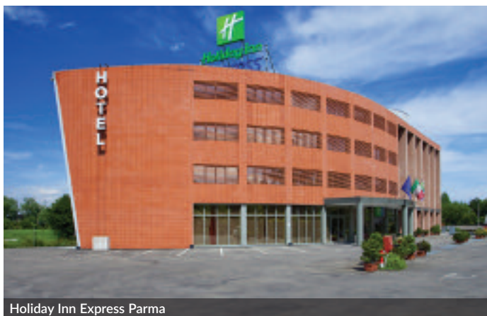
Holiday Inn Express Parma

Infine, per chi cerca privacy e autonomia, il residence Palazzo Toscani si propone con 19 appartamenti, tra mono, bilo e trilocali, a cinque minuti dal centro, ma in