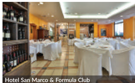
Hotel San Marco & Formula Club