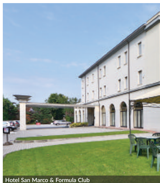
Hotel San Marco & Formula Club