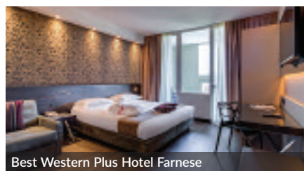
Best Western Plus Hotel Farnese

F eeling guests, but in their own house. The Incerti Family, involved in hospitality sector in the Emilia Romagna centre for almost one hundred years, embodies values that are basis of relationship between hotel facility and territory. They embrace principle of family management and passion that is passed from generation to generation, in order to offer a personal, careful and warm experience. Established in Parma, but with facilities also in Reggio Emilia and Piacenza, today the Group has seven hotels and one residence, for a total of 600 rooms, 19 apartments, 24 meeting rooms which can accommodate up to