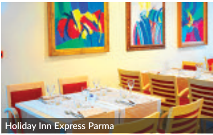
Holiday Inn Express Parma

three rooms for events and meetings, it settled up some business rooms so that they can be turned into a perfect office during daytime. Furthermore, it offers early breakfast and fast check out, use of printer and photocopier and, on request, a support for PC is available for being able to work anywhere and autonomously. A library has been created for relaxing, with books dedicated to literature, art, gastronomy and natural scenery of Parma and surroundings, also in online version.