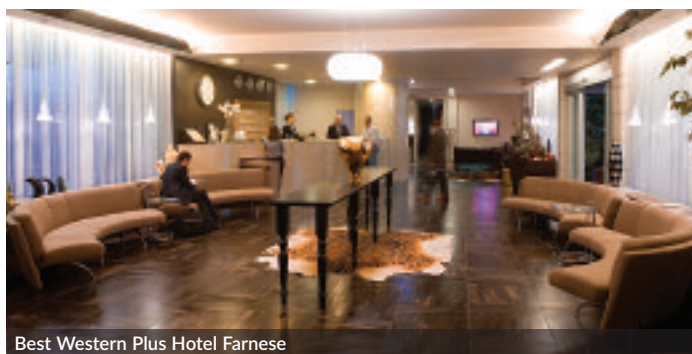
Best Western Plus Hotel Farnese

Eco-friendly, attentive to needs of those who travel for work but also of families, with an eye to cultural initiatives and wellbeing: these are the values which are the basis of hospitality signed by Incerti Group with its four facilities in Parma