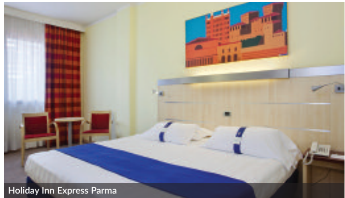
Holiday Inn Express Parma