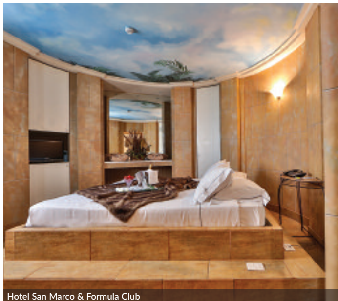
Hotel San Marco & Formula Club

Connection and information 24/7, working areas and illuminated cafés: these are just a few services designed for business traveller in the Incerti facilities, such as BW Farnese which, in addition to having