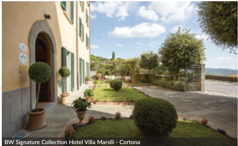
BW Signature Collection Hotel Villa Marsili - Cortona

ern has decided to bet on Aiden, an upper midscale brand. With strong design features, Aiden proposes a hospitality characterised by an innovative comfort, capable of enriching local proposal, favouring socialisation. The bar, ideal setting for relax and smart working moments, has been added to the design rooms in response to a question which, increasingly, searches for an offer of tailor made locations and services, capable of satisfying every typology, in terms of service, comfort and ambience.