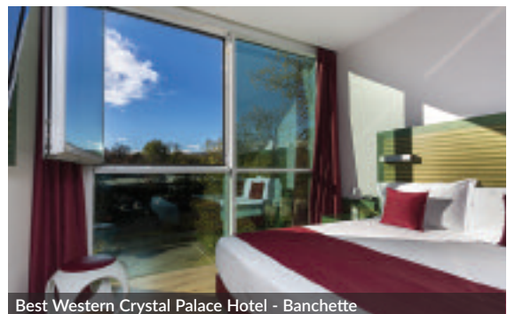
Best Western Crystal Palace Hotel - Banchette