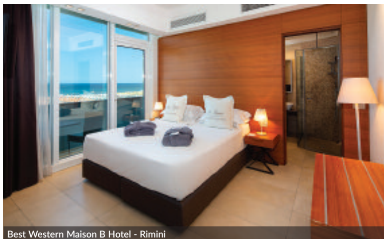
Best Western Maison B Hotel - Rimini

Con nuove 9 destinazioni, 14 new opening e ulteriori 950 camere, la catena alberghiera più diffusa in Italia scommette sul futuro e su Aiden, il brand più originale del portfolio