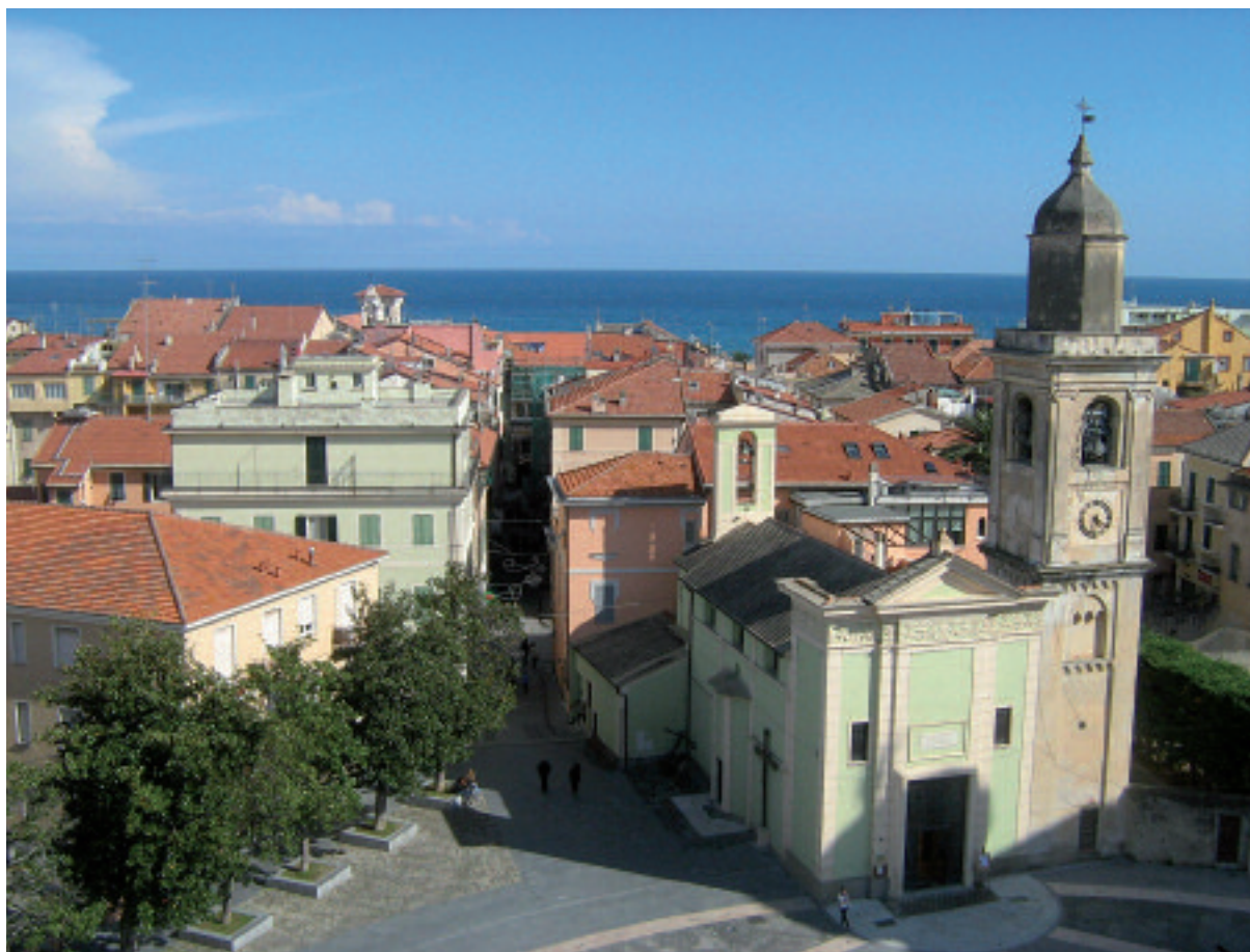
Sopra, il centro vecchio di Loano, per secoli dominata dal potente casato dei Doria. A destra, a spasso per i carruggi loanesi si ammira la Torre dell'Orologio

per offrire un servizio che sveli le eccellenze di un territorio variegato come il nostro è fondamentale per stare al passo con le sfide turistiche di oggi, sia a livello business che leisure. E si parte sempre dalla passione per questo lavoro, che è l'anima, oggi più che mai, di un'accoglienza di alto livello che si può fare strada a livello locale e globale. L'importante è unire all'ardore del far bene le regole del fare impresa con programmazione e fiducia nel futuro. Si parte quindi dal generale per arrivare a far conoscere e amare la nostra destinazione in tutti i suoi tanti dettagli di valore».