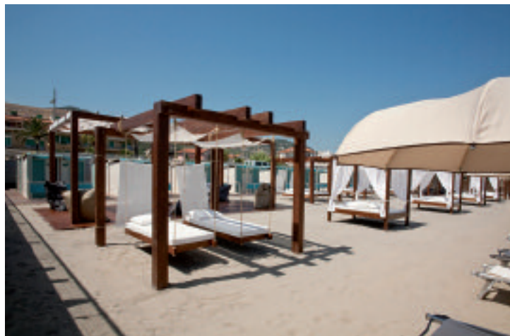
Sopra, spiaggia, terrazza lounge e club sono uniti dal brand BFly