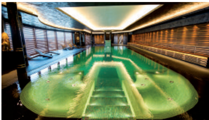
La Spa dell'Hotel Atlantic a Borgaro Torinese

Choice Hotels Europe, parte del gruppo Choice Hotels International, è una delle più importanti realtà di franchising, un gruppo che offre dei brand sinonimo di qualità per i viaggiatori in tutto il mondo. Un consolidato know-how, efficaci canali di distribuzione, un team di supporto attento ed efficiente, e soprattutto un'evoluta piattaforma di sales&marketing e revenue management sono le carte vincenti che hanno permesso al Gruppo un successo costante nel tempo. Choice Hotels, infatti, è presente con oltre 6.100 strutture in più di 30 paesi nel mondo, per un totale di circa 495.000 camere. In Europa conta circa 500 hotel, sparsi in 14 nazioni. I suoi 4 marchi, in grado di soddisfare le esigenze di ogni tipo di mercato, Clarion , Clarion Collection , Quality e Comfort ,