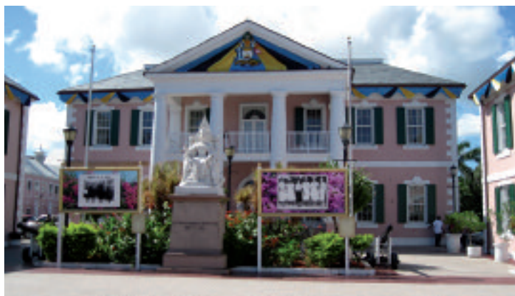
Il Palazzo del Governatore a Nassau. Sotto, il One&Only Ocean Club

con oltre due dozzine di possibilità diverse. Il centro congressi sta in una costruzione a parte, con due enormi sale per riunioni plenarie e numerose salette.