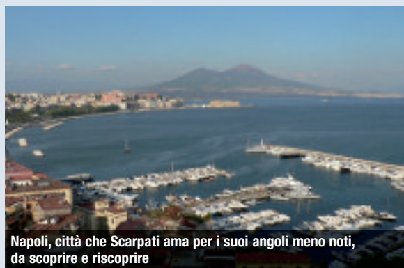
Napoli, città che Scarpati ama per i suoi angoli meno noti, da scoprire e riscoprire

hotel di catena, preferisco le piccole strutture a gestione familiare dove, tornando spesso, alla fine diventi come uno di famiglia. Guardo anche il servizio che deve essere puntuale e di buon livello».