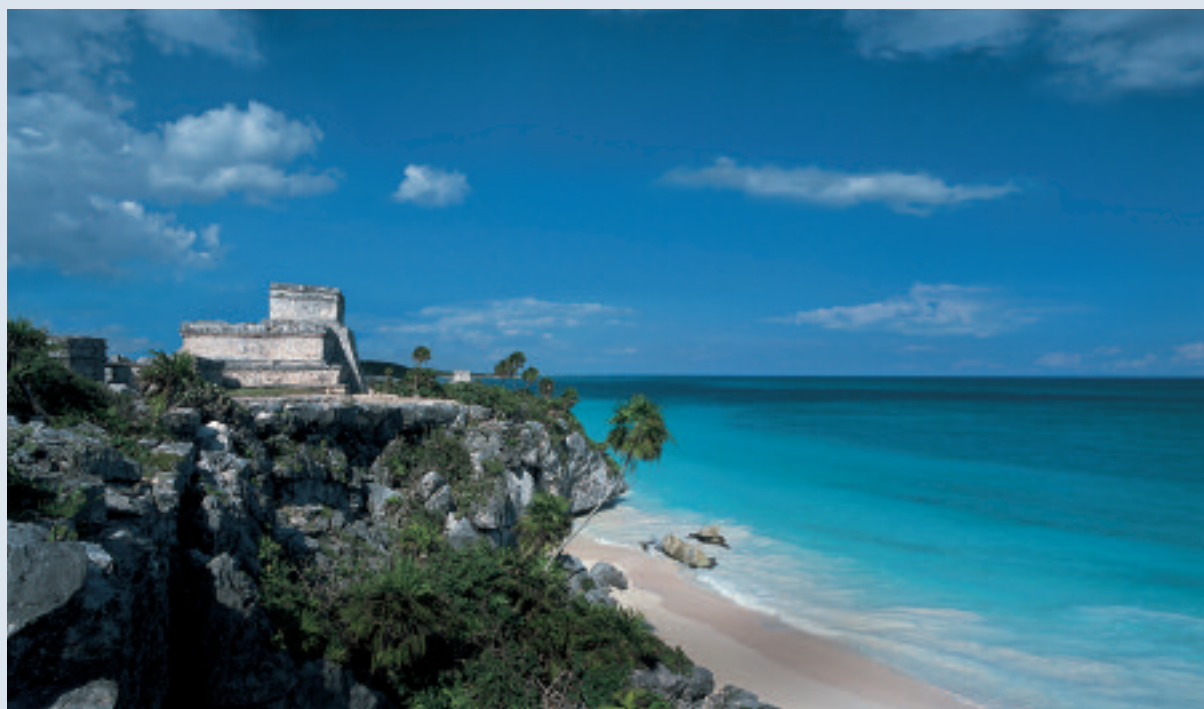
Le rovine di Tulum, sito archeologico dal fascino impagabile e destinazione preferita da Scarpati. In alto, a destra, dettaglio di un bagno con vasca idromassaggio. Quando viaggia l'attore predilige gli hotel con ampie stanze da bagno e confortevoli Spa

glierei un viaggio in Centro America, tra Messico meridionale, Guatemala e Belize, luoghi dal fascino ineguagliabile».