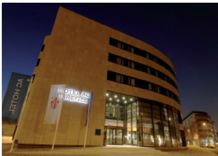
AC Hotels by Marriott Firenze

La dinamica catena alberghiera spagnola, presente in Italia con 10 strutture strategicamente posizionate in città chiave per il business, offre percorsi e proposte Mice anche nei più bei centri d'arte e cultura della Toscana