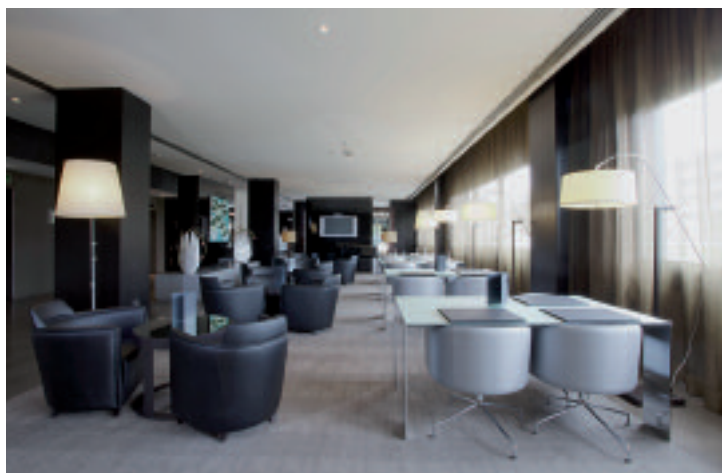
AC Hotels by Marriott Pisa

Nel capoluogo l'albergo, quattro stelle accanto al polo fieristico cittadino e in posizione strategica per raggiungere il centro