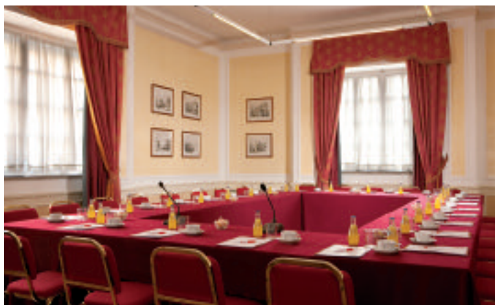
L'Hotel Atlantico e, sotto, l'Hotel Nord

45mq per 45 persone a platea; la "Sala Diocleziano" di 35mq per 30 persone a platea e la "Sala Massimo", di 36mq per 30 persone a platea. Altro ambiente spesso utilizzato per pre e post congress o per l'organizzazione di aperitivi e buffet è il Roof Garden "La Limonaia", con vista sul Museo Nazionale Romano di Palazzo Massimo e sulle Terme di Diocleziano.