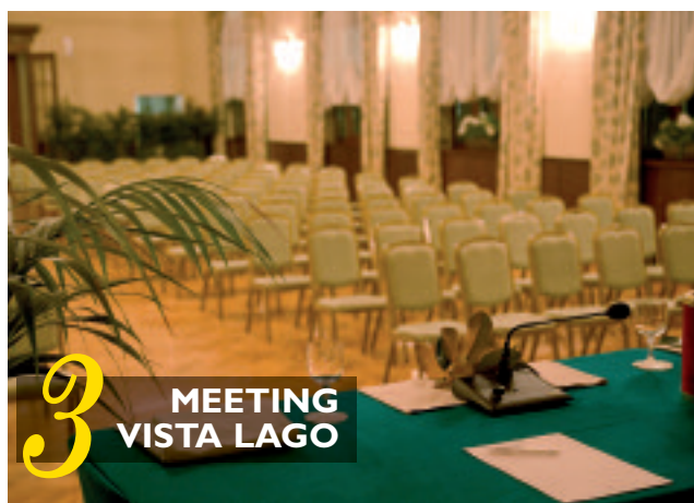
3 MEETING VISTA LAGO