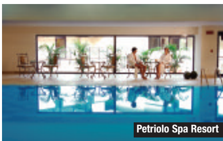
Petriolo Spa Resort

Negli hotel di Milano, Varese, Roma, Torino, Toscana, Sicilia, Sardegna e Madonna di Campiglio si può scegliere tra due pacchetti meeting: l'“Executive” (69,00 euro per persona fino a 49 partecipanti) e il “Presidential” (59,00 euro per persona con più di 50 partecipanti). Entrambi includono: Meeting room; 1 Light lunch e 2 Coffee Breaks base, Proiettore schermo e lavagna fogli mobili.