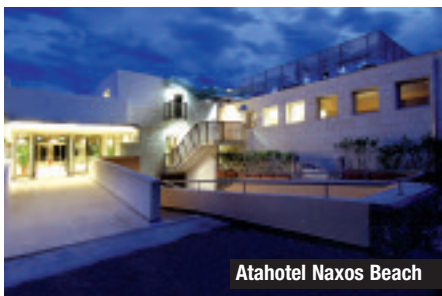
Atahotel Naxos Beach

tutta la catena in grado di rispondere con tempestività ad ogni richiesta, garantendo un servizio tailor made per meeting, incentive, congressi, exhibition, workshop, o car clinic: i meeting planner potranno contare sull'assistenza di un consulente personale che saprà suggerire anche come “sfruttare” al meglio l'offerta della destinazione, grazie a partnership con società e agenzie del posto. Per esempio, i resort di montagna e di mare si prestano per intriganti attività post congress. Si possono organizzare orienteering, regate veliche, giochi di squadra, escursioni guidate (4x4, barca, Bus, Quad, a cavallo, in mountain bike), praticare sport (beach soccer, beach volley, canoa, diving, tiro con l'arco, windsurf, trekking). Il Tanka Village in Sardegna e il Golf Hotel Campiglio in Madonna di Campiglio dispongono, poi, di due magnifici campi da golf rispettivamente da 18 e 9 buche. E l'ospitalità in Atahotels è life experience anche per quanto riguarda l'offerta benessere ed enogastronomica. Per