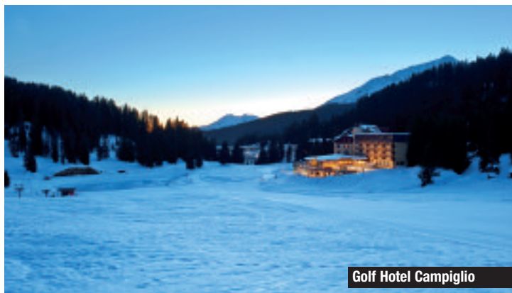
Golf Hotel Campiglio

esempio, nei due cinque stelle, Principi di Piemonte di Torino e Petriolo Spa Resort, gli ospiti potranno provare il “Wine & Food Tasting” e lo “Spa e benessere”, due percorsi all'insegna dell'esclusività e del bien vivre. ■