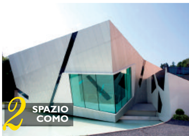
2 SPAZIO COMO