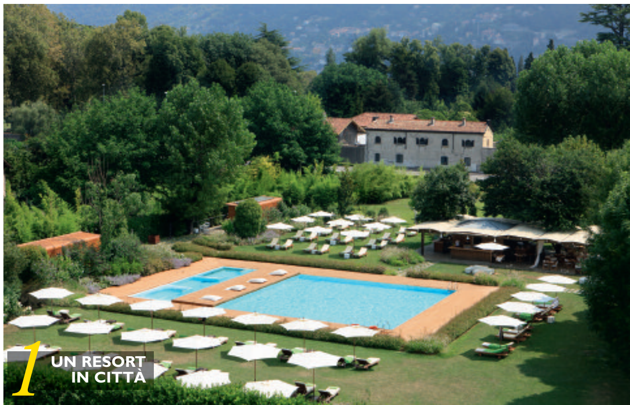
1 UN RESORT IN CITTÀ