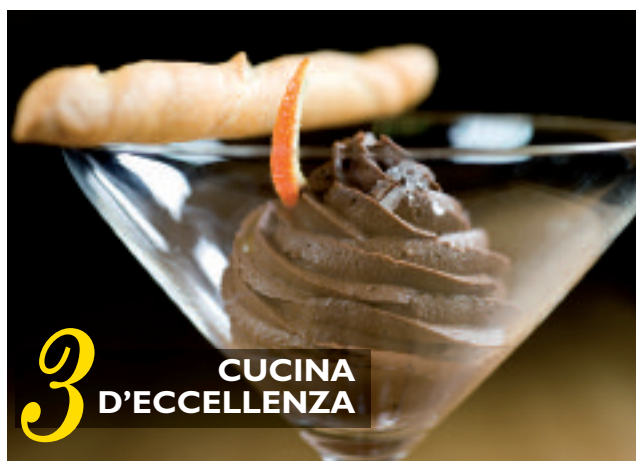
3 CUCINA D'ECCELLENZA