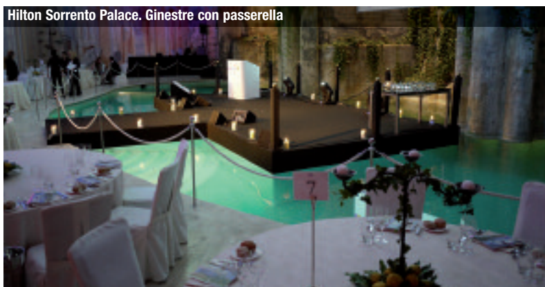
Hilton Sorrento Palace. Ginestre con passerella

Hilton Molino Stucky Venice: 2.600 mq; Ballroom fino a 1.000 persone disposte a cocktail, suddivisibile in 5 sale insonorizzate con accesso indipendente; il foyer di circa 700 mq fino a 750 persone; meeting room 6-40 persone; breakout rooms 6-12 posti; boardroom fino a 16 posti. Hilton Florence Metropole: 2 sale meeting di 500mq fino a 1000 delegati, divisibili in max 7 meeting room. Rome Cavalieri, Waldorf Astoria Hotels & Resorts: 9.000 mq suddivisi in 25 sale meeting e breakout areas, fino a 5.500 delegati; Salone dei Cavalieri, open space di 2.000 mq fino a 2.000 persone; "Sala Michelangelo" di 590 mq fino a 500 ospiti in piedi e 400 a teatro; "Sala Belle Arti", di 460 mq fino a 350 ospiti a teatro e 430 a banchetto. Hilton Rome Airport: 2500 mq, con 21 sale meeting; due Ballroom, fino a max 800 delegati; foyer di 400 mq; "Giardino dei Consoli", sala catering fino a 350 persone. Hilton Sorrento Palace: 3.500 mq; 24 sale meeting con auditorium da 1.500 posti.