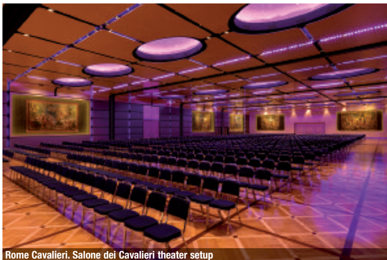
Rome Cavalieri. Salone dei Cavalieri theater setup