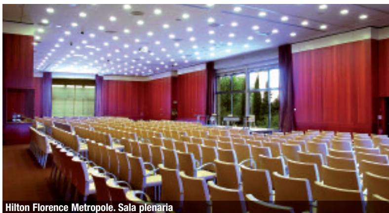
Hilton Florence Metropole. Sala plenaria