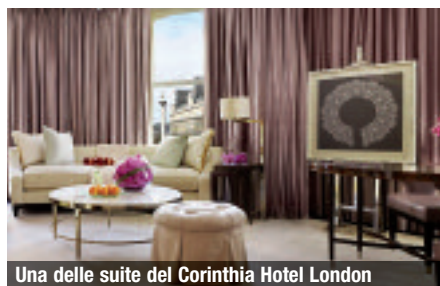
Una delle suite del Corinthia Hotel London

Come tutte le grandi capitali, Londra è capace di conservare gelosamente le sue tradizioni e al tempo stesso rinascere e cambiare se stessa nelle costruzioni, nello skyline, nei collegamenti e nei trasporti e naturalmente anche nell'offerta turistica. Ne sono esempio alcune zone nuove, diventate destinazioni di moda, come