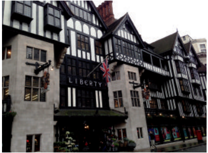
I grandi magazzini Liberty. In basso, Panorama da Canary Wharf

Per chi ha più tempo o più curiosità, va assolutamente consigliato il polo museale di Kensington, con il Natural History