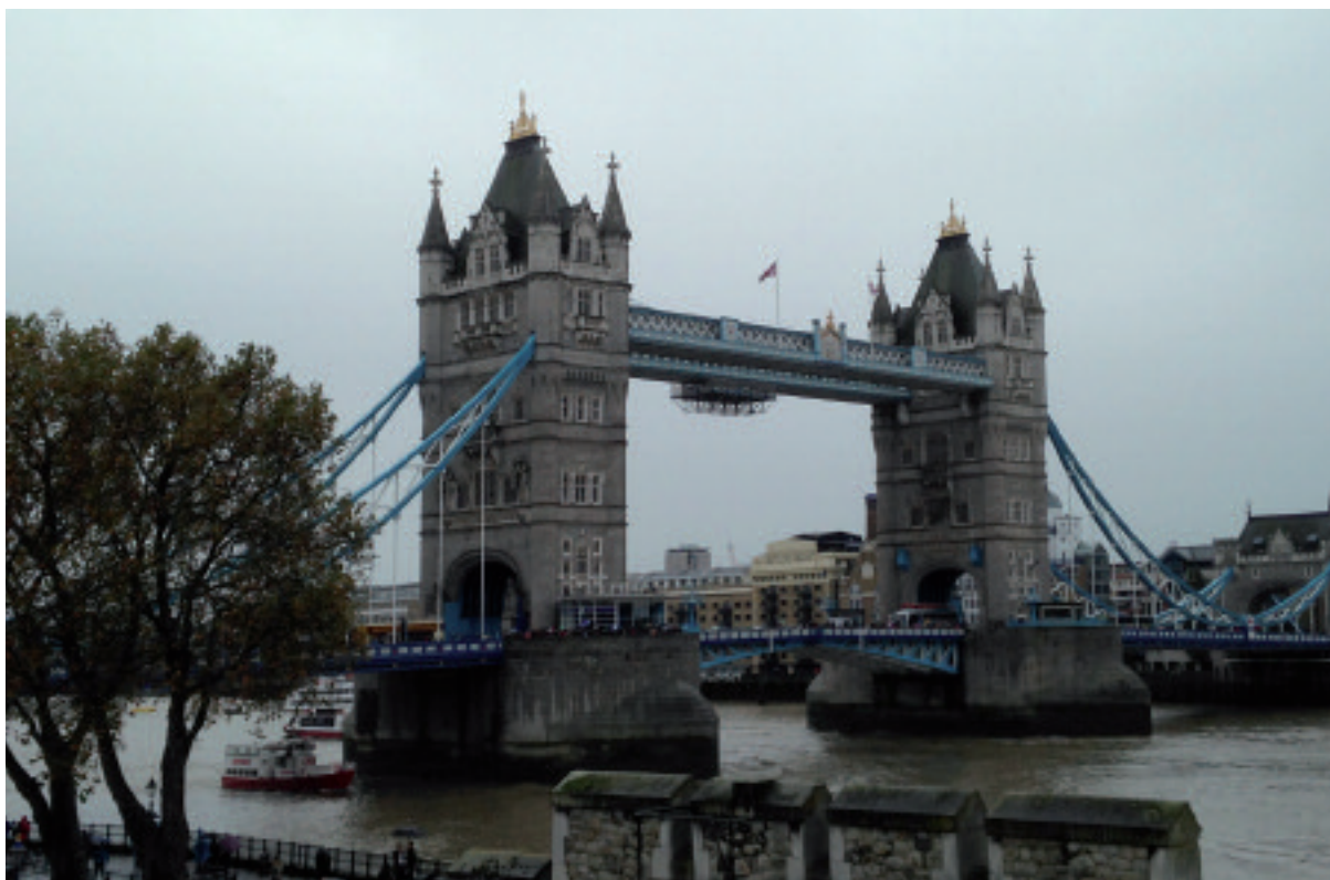
Il Tower Bridge

agli spettacoli che poi gireranno in Europa, specificamente nel campo dei musical che restano in cartellone per anni interi. Londra insieme a Broadway è trend setter mondiale in questo campo e non si