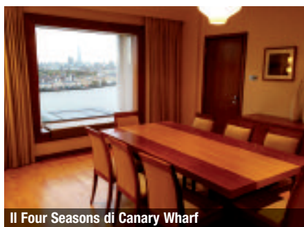
Il Four Seasons di Canary Wharf

l'antica zona dei docks, una penisola in un'ansa del Tamigi a est, quasi di fronte a Greenwich, che è diventata un animato distretto finanziario e di uffici dove lavo-