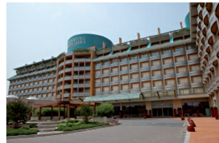
Atahotel Expo Fiera

Comodo e moderno. È un 4 stelle perfetto per soggiorni all'insegna di business, shopping, relax e divertimento. L'Atahotel Executive sorge, infatti, nel cuore del nuovo Business & Fashion District Porta Nuova - Garibaldi, punto nevralgico e principale crocevia della città, esattamente di fronte alla Stazione Garibaldi da cui partono i treni ad alta velocità Frecciarossa, Italo e "TGV" che permettono di raggiungere in poche ore le principali città italiane ed estere. Inoltre, il passante ferroviario consente di arrivare al polo fieristico di Pero Rho in soli 20 minuti e raggiungere quindi in brevissimo tempo il nuovo sito che ospiterà Expo 2015.