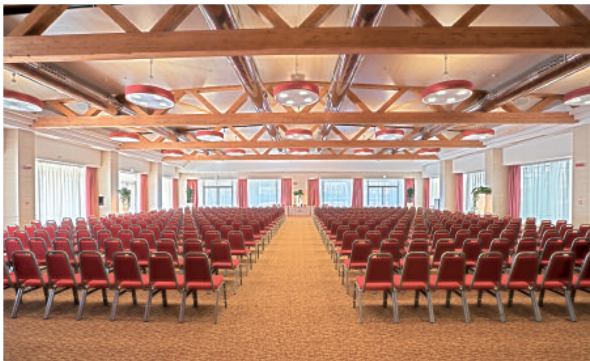
Atahotel Expo Fiera

Le camere, in tutto 420, sono eleganti e molto confortevoli grazie all'AtaBed, brevetto esclusivo studiato per garantire un sonno ristoratore, fondamentale per la sa-