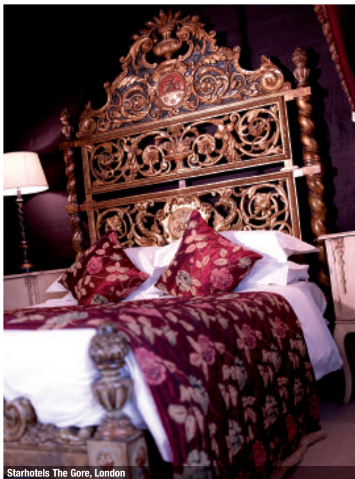
Starhotels The Gore, London

Elisabetta Fabri, President and CEO of Starhotels, has a single grand objective – ensuring for their guests the excellence and comfort they expect in accordance with the standards and values of the brand with an affection for what is Made in Italy. Love of Italy and its beauty, the character of the region and a passion for art and design are the hallmarks of the development plan successfully carried out by the Chain in the last 14 years. A plan which required a substantial investment – more than 300 million euros for major restyling and new acquisitions, such as the two latest charming boutique hotels in London – The Gore and The Pelham –