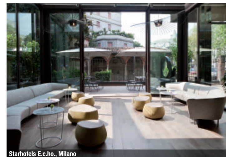
Starhotels E.c.ho., Milano

51 camere, elegante, luminosa il cui interior design sposa magnificamente il gusto vintage allo stile contemporaneo. ■