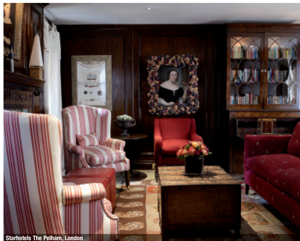
Starhotels The Pelham, London

An exclusive Starhotels brand, the Collection includes 7 hotels in extraordinary locations, each one unique for its architectural style, glamor, design and refined amenities. The Collection Hotels in Italy are the Rosa Grand in Milan, the Savoia Excelsior Palace in Trieste and the Splendid Venice in Venice itself. Abroad the brand includes the five-star Castille in Paris, the de luxe The Michelangelo in New York and the two new Londoners, The Gore and The Pelham, both in the residential district of South Kensington,