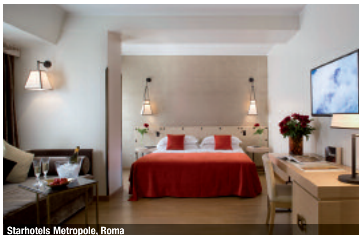
Starhotels Metropole, Roma