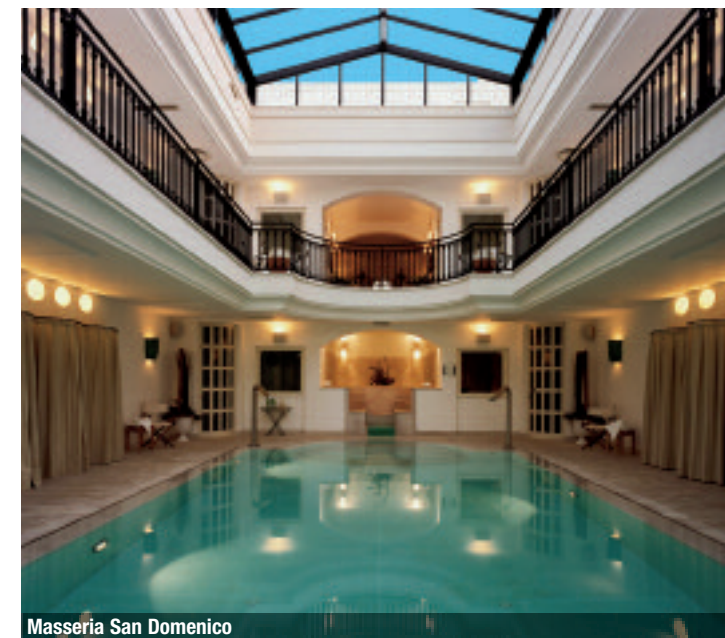
Masseria San Domenico