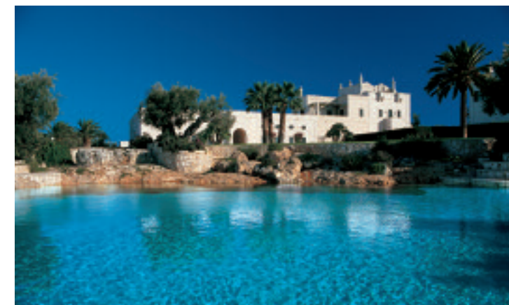
Masseria San Domenico