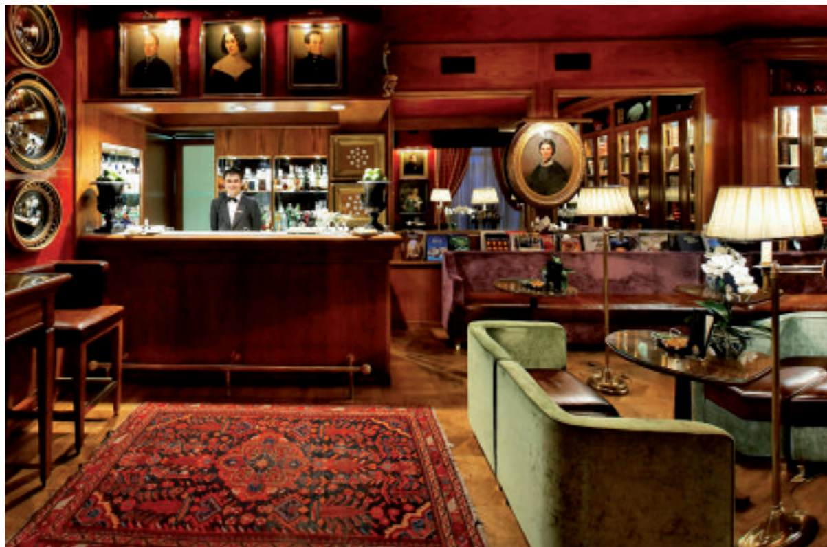
L'American Bar dell'Hotel de la Ville The American Bar at the Hotel de la Ville in Monza

A model of luxury hospitality for over fifty years, Hotel de la Ville is currently undergoing major refurbishment, thanks to the enthusiasm and professionalism of the new generation