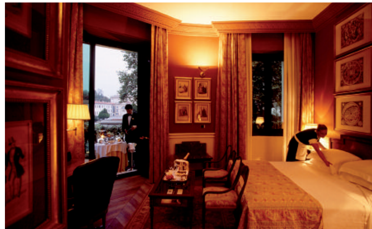
La junior suite affacciata sulla Villa Reale. The junior suite overlooking Villa Reale