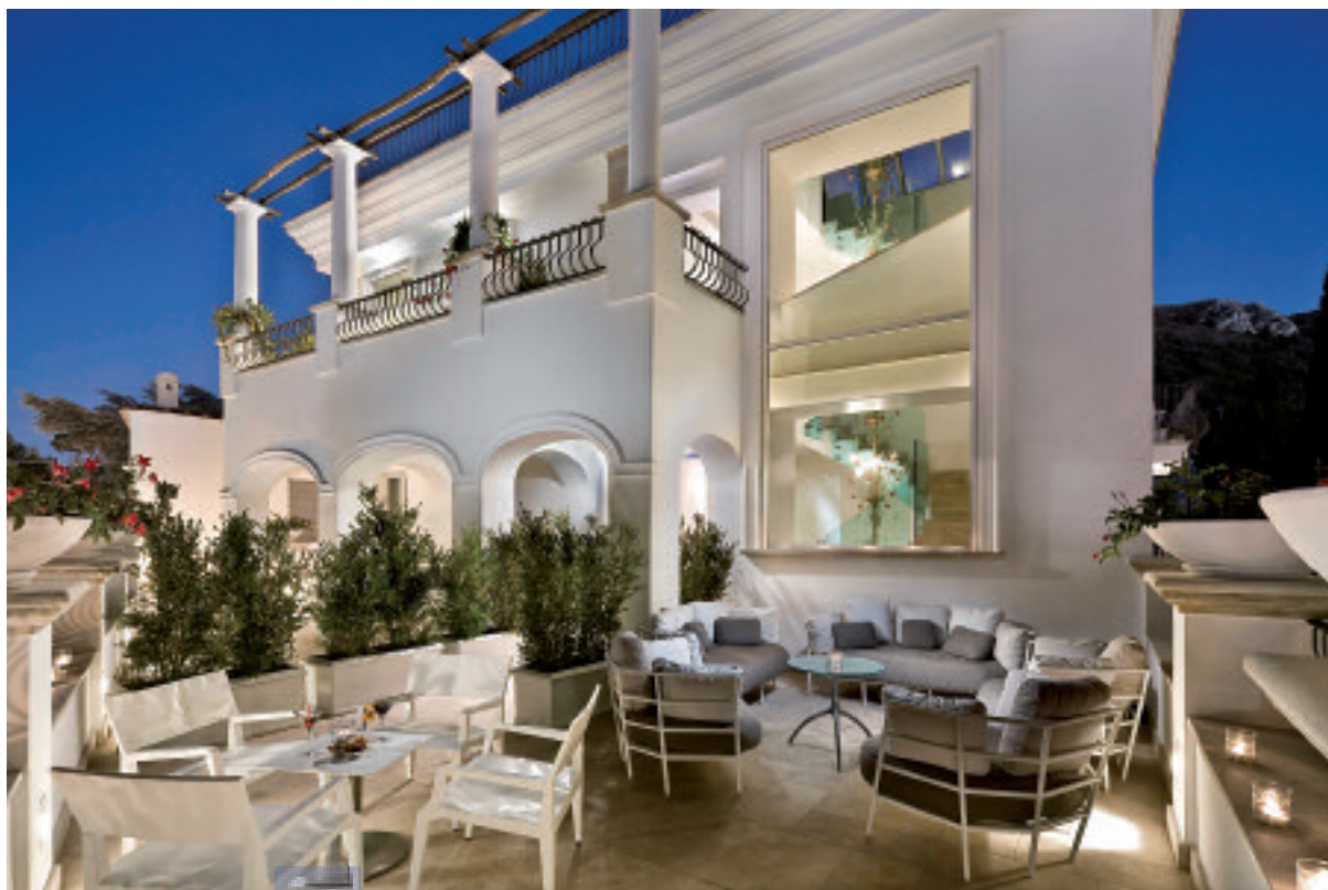
Sopra, Meliá Villa Capri- Front Terrace. Sotto, Meliá Milano Il Duca - Junior Suite Room

Il 2015 sarà un anno importante per Meliá Hotels International, il gruppo vedrà rafforzata la sua presenza anche in Italia – grazie al supporto del team Italia guidato da Palmiro Noschese – e grazie a un gran-