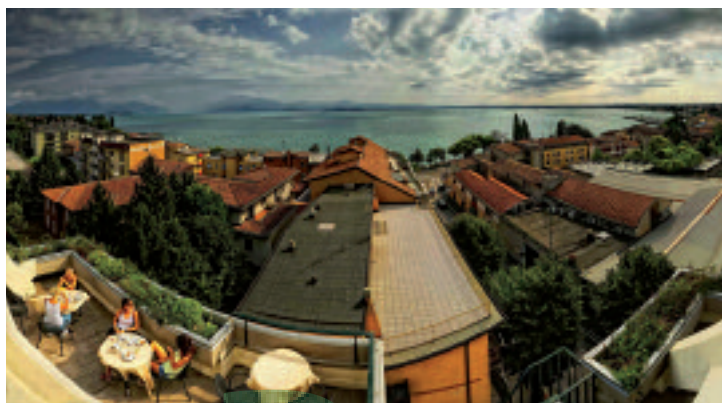
Hotel Bonotto, dove il cliente è Re

Un nuovo concept di hospitality unito a un network di partners e collaborazioni sul territorio per offrire un soggiorno attivo in cui il cliente viene prima di tutto e tutti