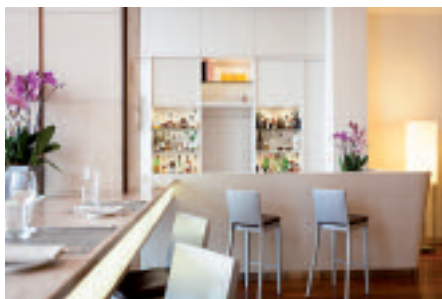
Immagini dell’Hilton Florence Metropole

uscite autostradali, a poca distanza dalle verdi colline toscane e a soli 20 minuti dalle principali attrazioni fiorentine. Raggiungere il centro di Firenze è comodo e veloce con un eccellente servizio navetta di 29 posti completamente gratuito e disponibile tutti i giorni ogni ora. A disposizione degli ospiti un comodo parcheggio gratuito per un massimo di 130 posti auto. Che siano standard o suites, tutte le 212 camere sono dotate di ogni comfort; scegliendo una delle camere Executive,