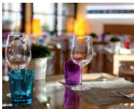
Immagini dell'Hilton Garden Inn Florence Novoli

potrete rilassarvi bevendo un cocktail o gustando qualche snack all'Executive Lounge, un'area dedicata al 15° piano, con vista mozzafiato sulla città di Firenze e sulle sue bellezze architettoniche. Assaporare la cucina toscana o piatti della cucina internazionale nella elegante atmosfera del Ristorante Luci della Città, o gustare un caffè italiano o un drink dissetante nel moderno Lounge Bar sono momenti da vivere in stile Hilton. Per rilassarsi, l'hotel dispone anche di un fitness centre con palestra aperta 24/7 ed un'area relax con Mega Whirlpool, cascata svedese e cromoterapia. L'Hilton Florence Metropole dispone inoltre di connessione WiFi gratuita nelle aree comuni e una business station a disposizione dei clienti 24 ore su 24. Punta di diamante è il luminoso e flessibile Centro Congressi, che può accogliere fino a 1000 partecipanti e offrire spazi dedicati in base alle richieste del cliente. Le 2 sale meeting da 500mq ciascuna sono modulabili in 10 sottosale di diverse dimensioni, tutte perfettamente insonorizzate, climatizzate e con accessi indipendenti. Le sale meeting del pian terreno hanno accesso diretto al parcheggio dell'Hotel, e si prestano quindi per organizzare speciali esposizioni, show room e lanci auto.