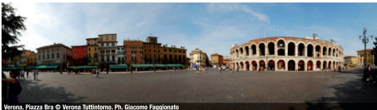
Verona. Piazza Bra

gono il sorriso, la professionalità, la creatività delle persone. In caso di meeting non ci si ferma davanti a nessun ostacolo, che si tratti di una serata a tema, di un'uscita nei parchi tematici del Garda o di un rodeo in piena regola. Ma l'Hotel Caesius, da anni, prima ancora che diventasse trendy partecipare a viaggi culturali, con il supporto di Europlan è in grado di offrire ai suoi ospiti escursioni giornaliere, sia in barca che in pullman gran turismo. Le escursioni sono varie e permettono di impreziosire le giornate di vacanza soprattutto da giugno a settembre. Event manager e pco possono organizzare un incentive a bordo del brigantino San Nicolò, oppure fare un "girolago" in bus e battello, per scoprire porticcioli, isolotti e castelli e possono anche visitare i siti Unesco: Verona, Venezia e la sua laguna, scegliendo tra diversi programmi "Venezia classica", "Venezia di notte", "Mantova & Sigurtà", oppure le "Grandi Dolomiti". L.S.