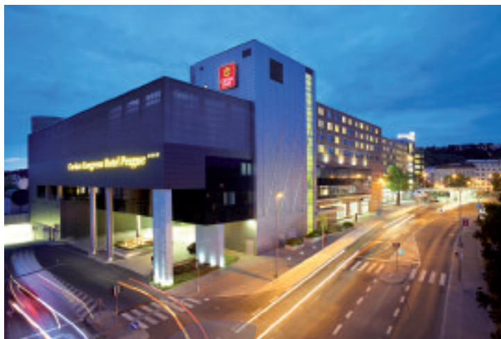
Sopra, Clarion Congress Hotel Prague, Praga. A destra, The Howard, a member of Ascend Hotel Collection, Edimburgo

Choice Hotels è uno dei più grandi gruppi alberghieri al mondo con 6.400 alberghi affiliati in 35 diverse nazioni. In particolare, il portfolio di alberghi in franchising di Choice Hotels Europe offre sia al viaggiatore d'affari sia a quello dal profilo leisure una gamma completa di soluzioni che varia dall'hotel vivace con atmosfera accogliente a sistemazioni di prima classe. Al momento, Choice Hotels ha affiliato quasi 500 hotel in tutta Europa e altri sono in fase di sviluppo. I brand in franchising di Choice Hotels Europe includono Clarion , che si rivolge a chi esige una sistemazione di prima classe e attenzione al dettaglio; Clarion Collection , con hotel di design o dimore storiche con un carattere che riflette il territorio locale; Quality , con strutture generalmente situate in grandi città ed aree commerciali, pensate per tutti i profili di viaggiatori; Comfort , il brand particolarmente apprezzato dai viaggiatori per il rapporto qualità/prezzo e l'affidabilità. Choice Hotels, inoltre, offre ai suoi ospiti boutique hotel ed alberghi unici di fascia alta con il soft-brand