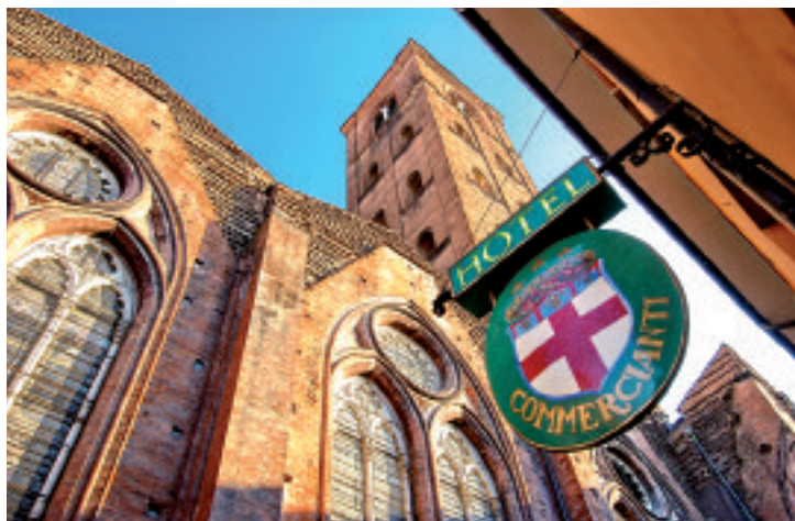
Sopra, due immagini dell'Art Hotel Commercianti. In basso, un salotto dell'Art Studio Commercianti

Varchi la soglia di un Art Hotels e sei nel cuore della Bologna più vera, la Bologna della storia, dell'arte e del buon gusto. Curati in ogni dettaglio, questi quattro gioielli dell'ospitalità – l'Art Hotel Commercianti, l'Art Hotel Novecento, l'Art Hotel Orologio e De Luxe Apartments Corte e Palazzo – offrono un'esclusiva experience a cinque sensi nel centro storico della città, a un passo dai monumenti, dai musei, ma anche dalle vie dello shopping e dai ristoranti più tipici e rinomati. A connotare gli Art Hotels sono i particolari unici, la passione per la qualità e la bellezza. In particolare, le Suite de luxe, fiore all'occhiello del lifestyle brand, sono un vero e proprio museo privato con affreschi e soffitti lignei del XVI, ma anche statue e quadri contemporanei provenienti da importanti gallerie cittadine.