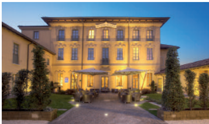
Qui sopra (above), Best Western Villa Appiani. A destra (right), Enterprise Hotel. In basso (below), Grand Hotel Savoia, Genova

Italian Group founded in the mid-90s, it immediately distinguished itself with a “sartorial” and innovative style of hospitality which makes the stay of its guests unique