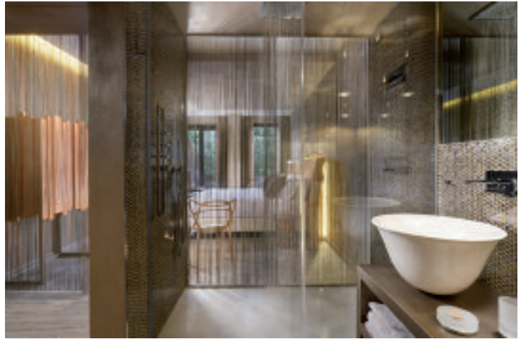
Milan Suite Hotel, Naked Room. Sotto (below), Enterprise Hotel, Sophia's Restaurant

Fiume, natura e storia caratterizzano an-