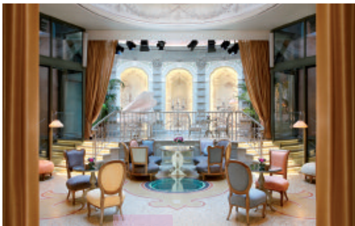
Sopra (above), Château Monfort Lounge Bar Mezzanotte by Venissa. A destra (right), Hotel Pulitzer lounge bar. In basso (below), Ville sull'Arno

Gruppo italiano nato a metà degli anni '90, si è distinto da subito per uno stile di ospitalità "sartoriale" e innovativo che rende unico il soggiorno dei suoi ospiti