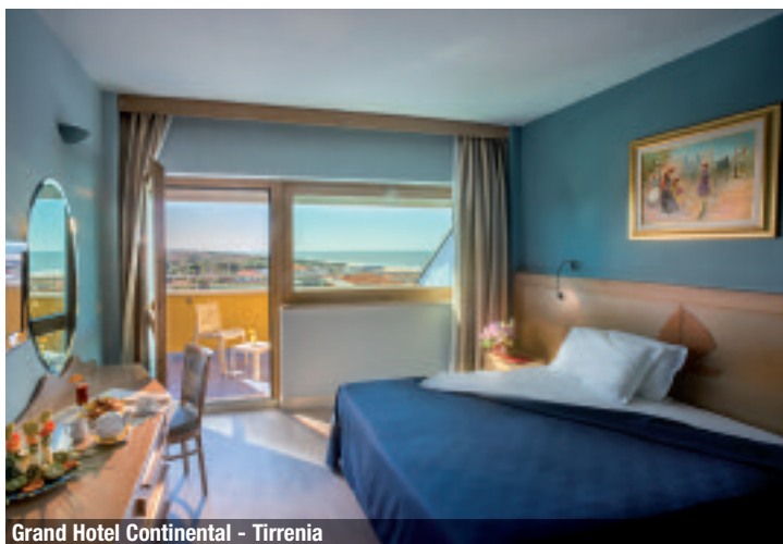
Grand Hotel Continental - Tirrenia

È la struttura con maggiore vocazione congressuale con la sua posizione tra le bellezze del territorio incastonato tra il litorale turchino e una macchia mediterranea.