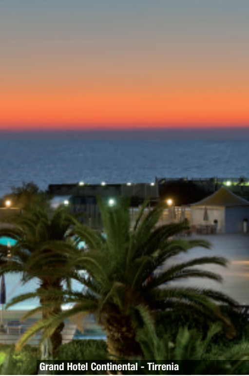
Grand Hotel Continental - Tirrenia

nea dai piacevoli effetti sul clima. L'hotel è una delle strutture leader della Regione per l'accoglienza di meeting, ma anche meta preferita di un turismo leisure internazionale che sa esattamente cosa cercare: cortesia e servizio. Ad appena 15 km dalla Torre di Pisa e dall'Aeroporto internazionale Galileo Galilei, a 9 km dall'uscita autostradale eppure affacciato direttamente sul lungomare di Tirrenia, l'hotel offre 175 camere e 4 Suite (recentemente rinnovate ed ora tutte con parquet). Situato a due passi dal Grand Hotel Continental e collegato attraverso l'ampio giardino, il Continental Resort conta 50 appartamenti finemente arredati e dotati di ogni comfort. Circondato da ampi spazi verdi ed eleganti giardini, questo Resort è