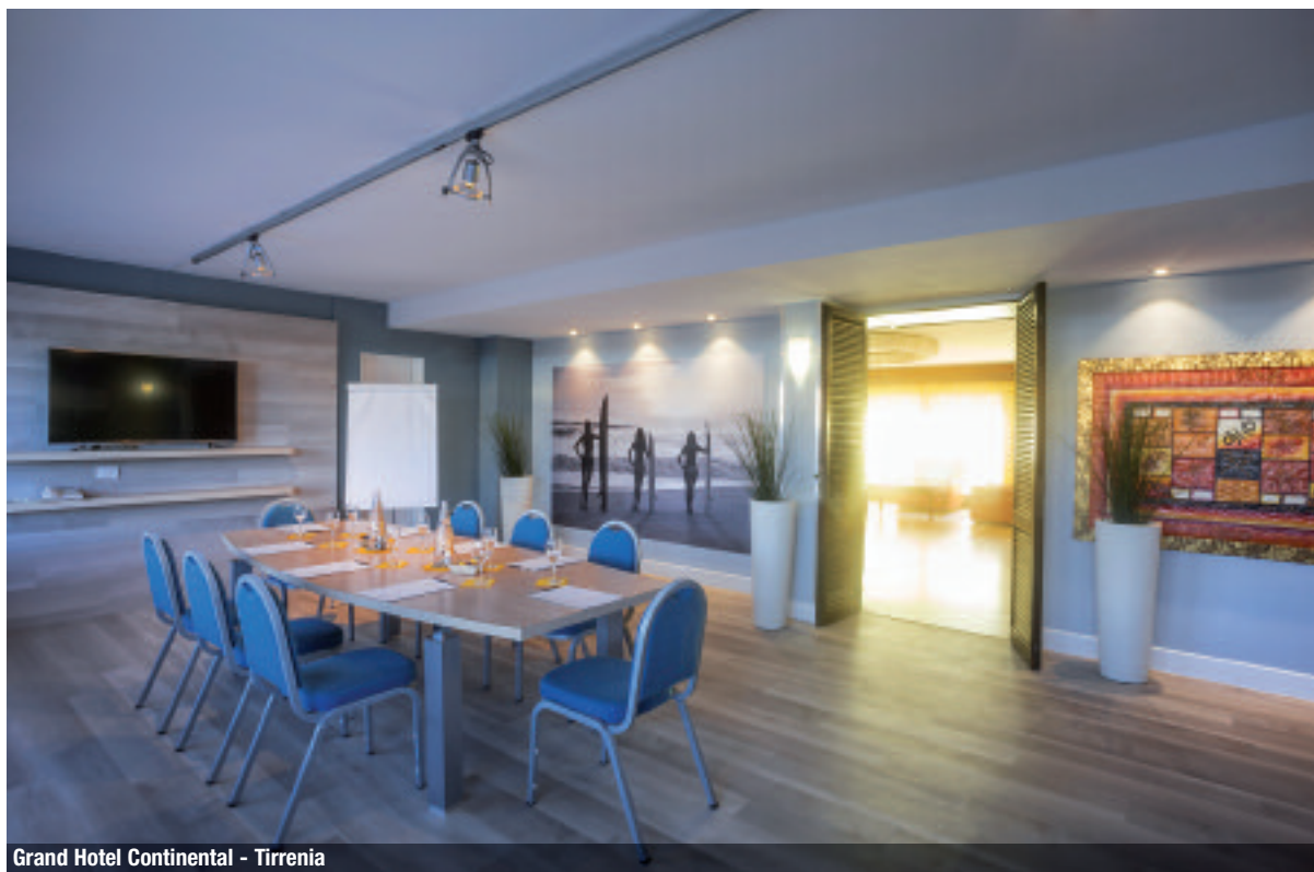
Grand Hotel Continental - Tirrenia

Attentions to detail, tailor made service and wonderful locations make the Group's facilities the ideal starting point to the discovery of the Tuscan beauties