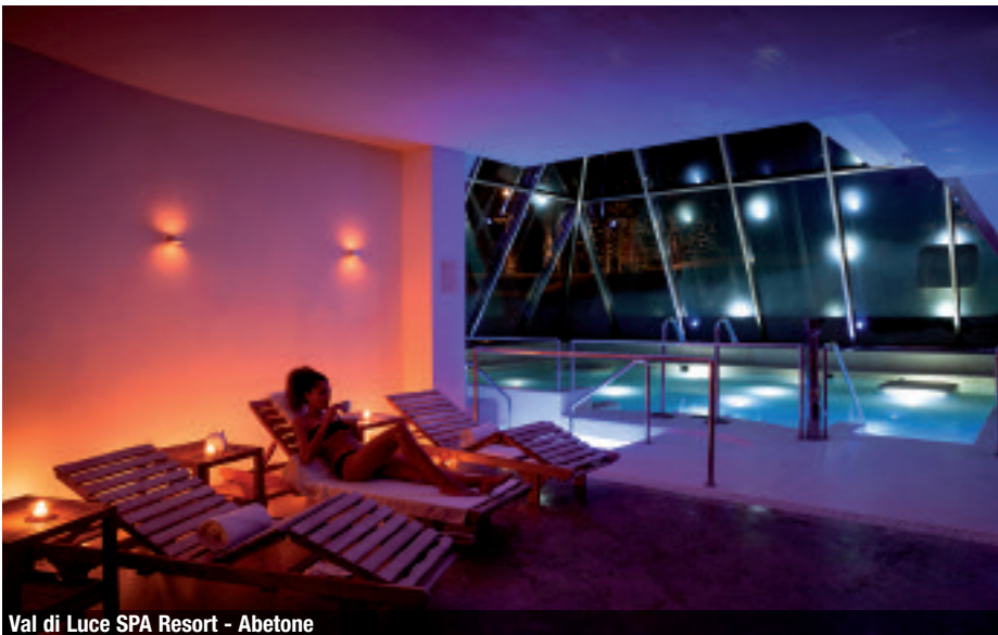
Val di Luce SPA Resort - Abetone