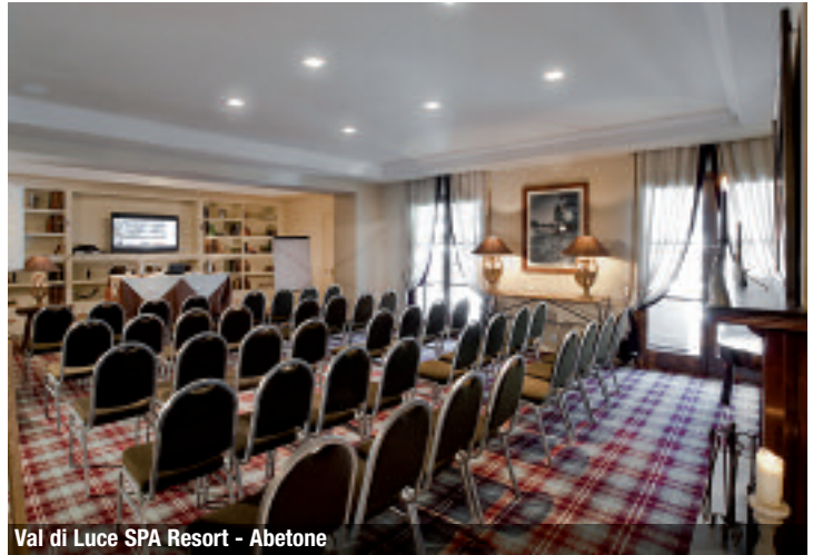
Val di Luce SPA Resort - Abetone

It is the facility with the biggest conference vocation with its placement among the beauties of the territory between the deep blue coast and a scrub land that affects positively the climate. The hotel is one of the leading facilities of the Region due to meetings, but also favourite destination for international leisure tourists who know what to look for: courtesy and service. At just 15 km from Torre di Pisa and from International Airport Galileo Galilei, at 9 km from the motorway exit, yet overlooking the boardwalk of Tirrenia, the hotel has 175 rooms and 4 suites (recently renovated with hardwood floors). Located a few steps from Grand Hotel Continental and linked to it by the large garden, the Continental Resort includes 50 apartments finely decorated and equipped with every comfort. Surrounded by large green areas and elegant gardens, this Resort is ideal for the guests who don't want to give up to their privacy, but are still interested in several leisure opportunities and comforts of the principal building. During spring and summer Grand Hotel Continental' guests can use direct access to the large equipped beach, and eat in a restaurant hall overlooking a patio with pool, a fresh place for a break or a quick light meal.