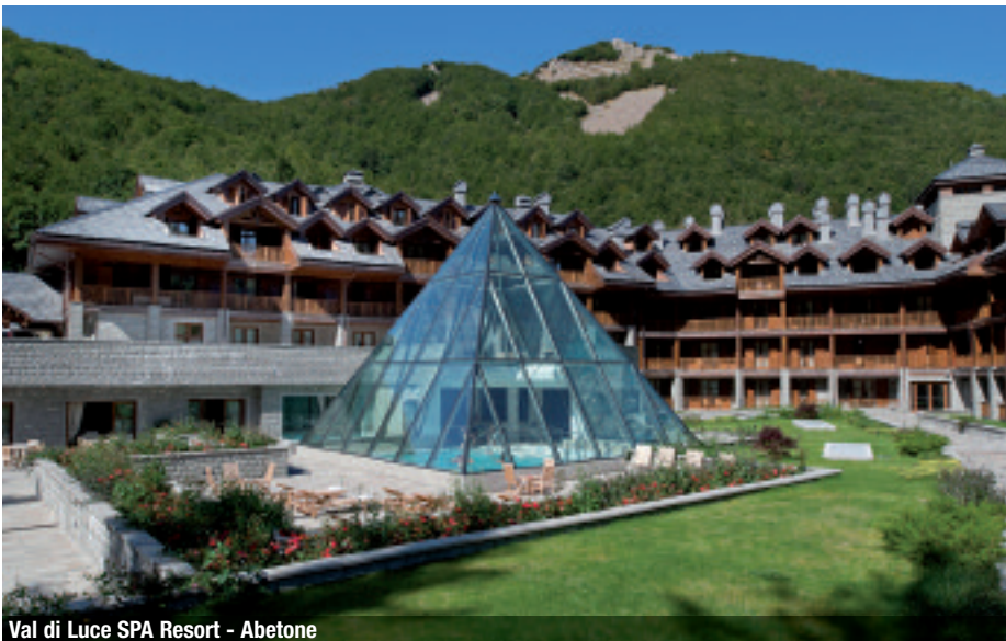
Val di Luce SPA Resort - Abetone