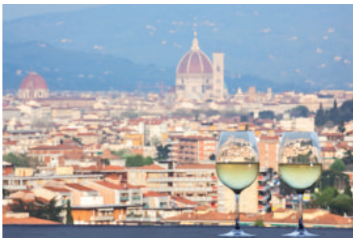
Alcune vedute dell'Hilton Florence Metropole

I due Hilton Hotels di Firenze sono la soluzione ideale per scoprire le bellezze della città, grazie alla loro ubicazione strategica, a poca distanza dal centro storico, dall'aeroporto e dalle principali uscite autostradali