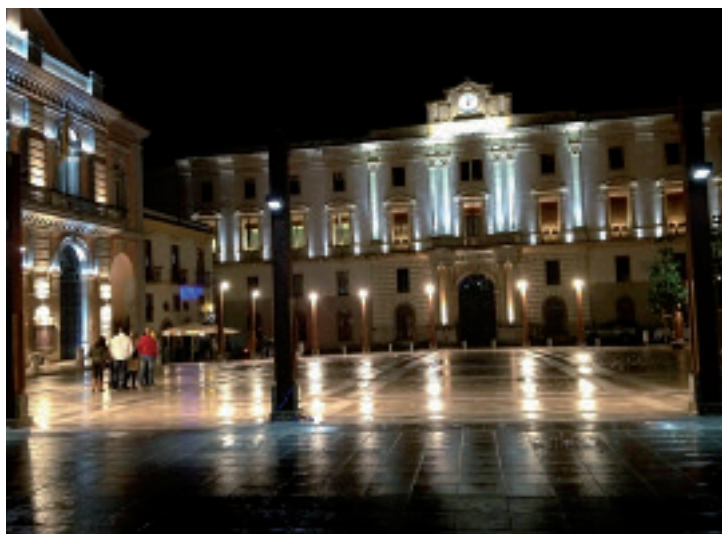
Qui sopra da sinistra: Piazza della Prefettura a Potenza, salotto cittadino, e una veduta del Sasso Barisano a Matera, tra scalinate e terrazze scavate nel tufo

dai Longobardi per affrontare le incursioni greche e dalla statua del Cristo reudentore che tutto domina e protegge con i suoi 21 metri di altezza. Insomma in appena 30 chilometri di costa tirrenica la Basilicata riesce a mettere in mostra davvero il meglio di se, tra montagne di origine vulcanica che scendono a picco per incontrare il verde smeraldo del mare, riparate insenature impreziosite da spiagge piccole e tutte diverse, alcune con sabbia bianchissima e altre nere per la loro origine lavica. Senza dimenticare che in quanto località di grande appeal turistico, sia business che leisure, Maratea è da sempre dotata di strutture ricettive all'avanguardia e che sono ampiamente diversificate nella tipologia e quindi disponibili anche ai tanti diversi usi di ambito Mice.