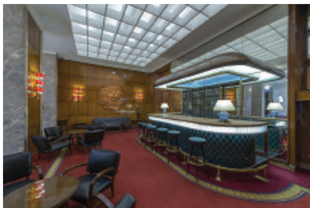
Massimo D'Azeglio. In basso, Sala Cavour Hotel Atlantico

Five generations have followed one another at the helm of the group until today, where, thanks to the chairmanship of Maurizio Bettoja, the hotel services of the three large hotels, located in a strategic area, confirm their role as protagonists in the hospitality market. High speed has brought back the train journey and the location of the Bettoja hotels is absolutely a real strength, which is renewed thanks to the investment and passion of the family hotel. And if the Bettoja tradition has been handed down for generations, evolving its hospitality according to modern needs, 2018 be-