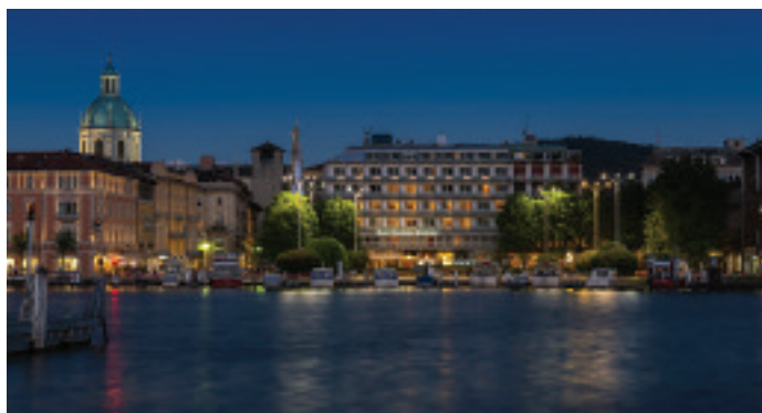
Hotel Barchetta Excelsior

Il Palace Hotel si trova inoltre in una posizione strategica per organizzare attività in città o sul lago, tra escursioni memorabili, visite ai principali musei tra cui il caratteristico Museo della Seta, la possibilità di praticare diversi sport acquatici o di rilassarsi con un aperitivo in barca.