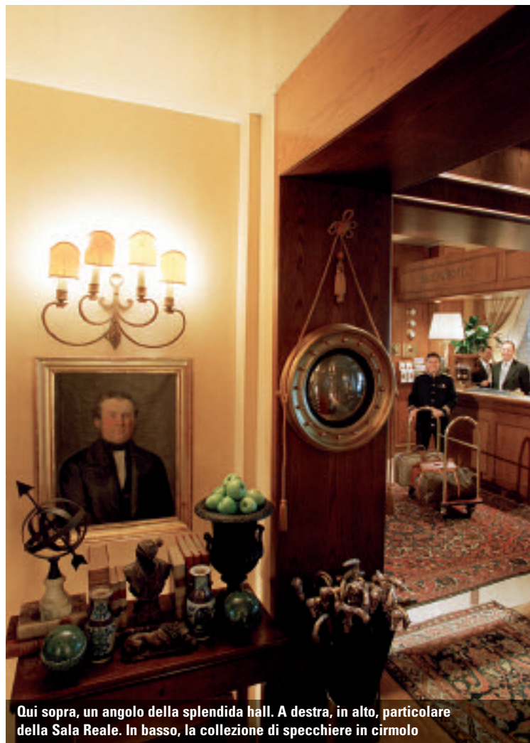
Qui sopra, un angolo della splendida hall. A destra, in alto, particolare della Sala Reale. In basso, la collezione di specchiere in cirmolo

UN GUSTO PARTICOLARE PER IL LUSSO E IL COLLEZIONISMO. E UNA PREDILEZIONE PER L'INNOVAZIONE TECNOLOGICA. È L'HOTEL DE LA VILLE DI MONZA, UNA SPLENDIDA RESIDENZA DI "CHARME" DOVE TRADIZIONE E MODERNITÀ SI COMBINANO AD ARTE