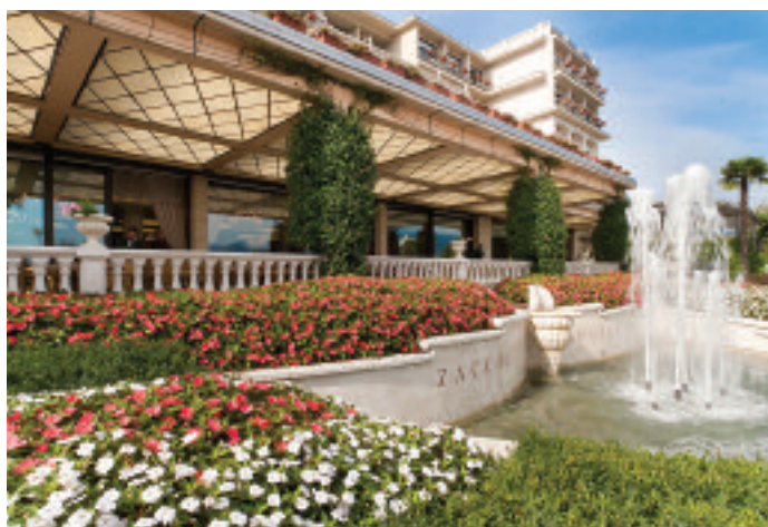
Grand Hotel Bristol

its ROI. Last May, in Abano Terme, during the sixth edition of EMAS Italia, which rewards municipalities, hotels and companies that are more environmentally aware, a double recognition was awarded to the Zacchera Group. The first one to the Grand Hotel Bristol in the “Environmental statements” section for having made accessible and attractive documents of subscription to EMAS and sustainability measures; the second one to the Grand Hotel Dino for the “Communications initiatives of sustainability”, for more efficient campaign on saving of resources aimed to customers and suppliers. Moreover, the Grand Hotel Dino renews, until 2022, the ISO 14001:2015 certification by Agroqualità for the supply of hotel services with pertaining catering activities, swimming pool and conference activities. In short, it's appropriate to say, in Zacchera family, heart beats in unison, increasingly strong and clear. And even more green.