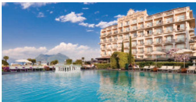
Grand Hotel Bristol

Anche quest'anno, la politica green adottata dal Gruppo non ha mancato di portarsi a casa il suo ROI. Lo scorso maggio, ad Abano Terme, durante la sesta edizione di Emas Italia, che premia i comuni, gli alberghi e le aziende più sensibili all'ambiente, è stato assegnato al Gruppo Zacchera un doppio riconoscimento. Al Grand Hotel Bristol nella sezione "Dichiarazioni ambientali" per aver reso frui-