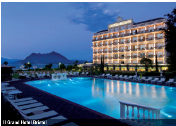
Il Grand Hotel Bristol