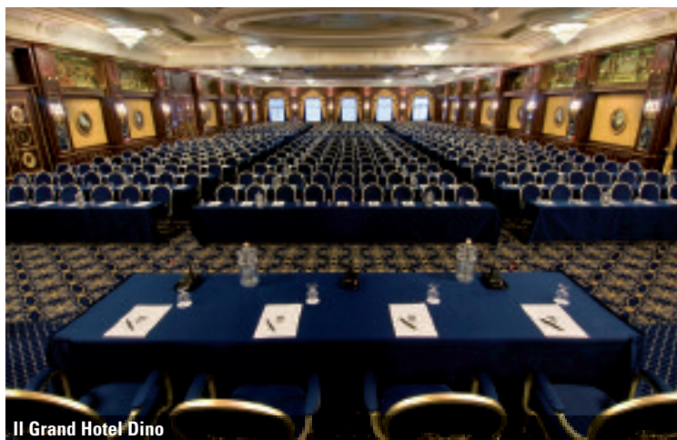
Il Grand Hotel Dino