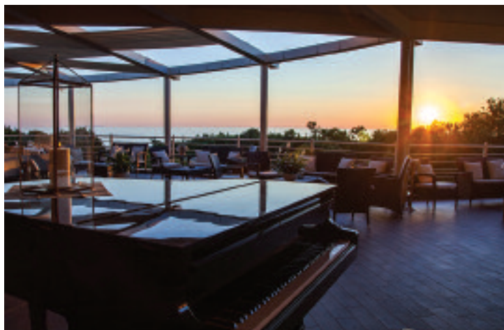
Tombolo Talasso Resort

Un'esclusiva combinazione tra un lusso moderno, un piacevole comfort fatto di dettagli di qualità, un'accoglienza personalizzata e in costante rinnovamento