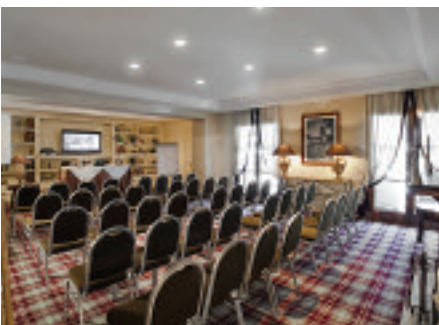
Val di Luce SPA Resort